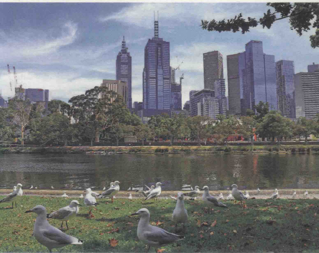
▲ 墨尔本阳光明媚，蓝天白云，令人心情愉悦

原租客搬走的当天我们便急不可待地委托房产中介赶快把房子租出去，在“财迷”的我看来闲置一天都是一种罪过，一天没出租出去就损失一天的钱，那感觉简直心如刀割。