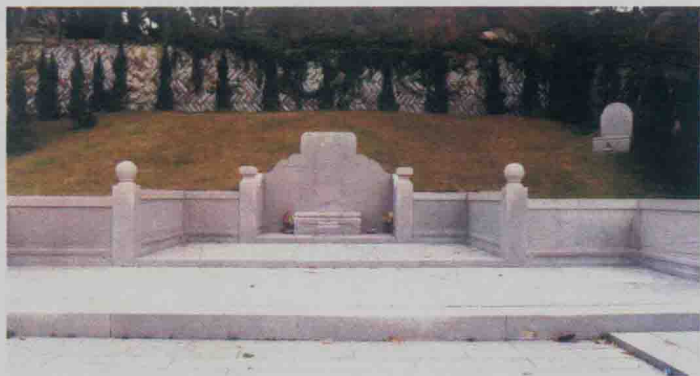
晋江八仙山张瑞图墓

崇祯十四年(1641年),大明政权覆灭的前夜,张瑞图走完一个才华横溢、平和率直的知识分子的一生,平静地逝世于晋江老家,享年七十二岁。三年后,崇祯皇帝朱由检吊死在煤山上,他笑到后面,但并没有笑得最好。