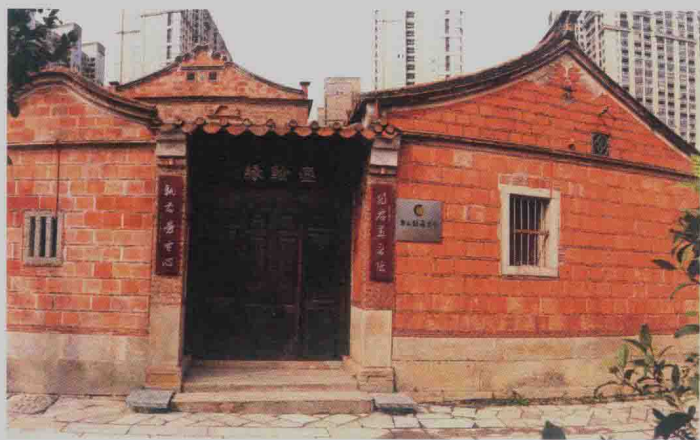
晋江五店市传统街区内的张瑞图研究所

京任职去了，这固然是他性格较为懦弱、易于动摇的表现，也由于他家境比较清贫，毕竟任官有一笔薪俸在吸引着他。他期待在昏乱的朝廷中自己可以独善其身，“食清游浊”。从《明大学士张瑞图暨夫人王氏墓志铭》可以看出，张瑞图天启六年（1626年）七月任礼部尚书兼东阁学士，进入政权核心，一直到天启七年（1627年）四月皇帝驾崩、魏党倒台，他在朝廷上确实没有什么同魏党同流合污的实迹，倒是做了不少机警地同魏忠贤周旋，针锋相对，力挽狂澜，援救一批正人君子的好事。当时魏忠贤势炎滔天，他建生祠是皇帝批准的，皇帝朱由校亲自为他题匾，首辅施凤来撰文，点名让张瑞图书丹，他推辞得了吗？他若公开与魏忠贤作对，能在朝廷上站得住脚、发挥自己的特殊作用吗？可是新上台的崇祯皇帝朱由检并不能体谅张瑞图的一番苦心。他是一个刚愎自用的君主，需要摒弃前朝旧辅，培植自己的羽翼。因此，为魏忠贤生祠书丹成