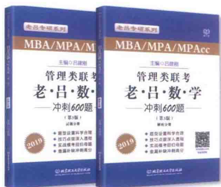
《管理类联考·老吕数学冲刺600题》 (试题分册+解析分册)