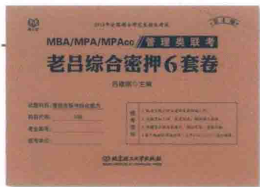
《管理类联考·老吕综合密押6套卷》