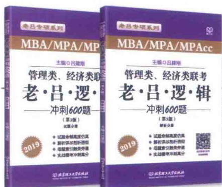
《管理类、经济类联考·老吕逻辑冲刺600题》 (试题分册+解析分册)