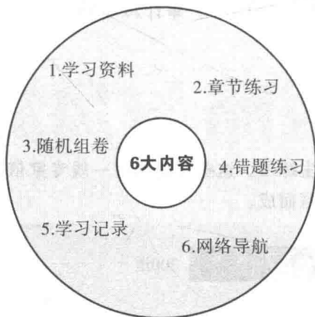
图 2 上机操作系统

我们将随书赠送注册会计师全国统一考试操作系统(简称“光盘”)。光盘是本书的重要组成部分,其中收录了优质题源,试题按照章节划分。光盘与书中的试题相结合,共同构成了本套辅导用书的上机考试题库。