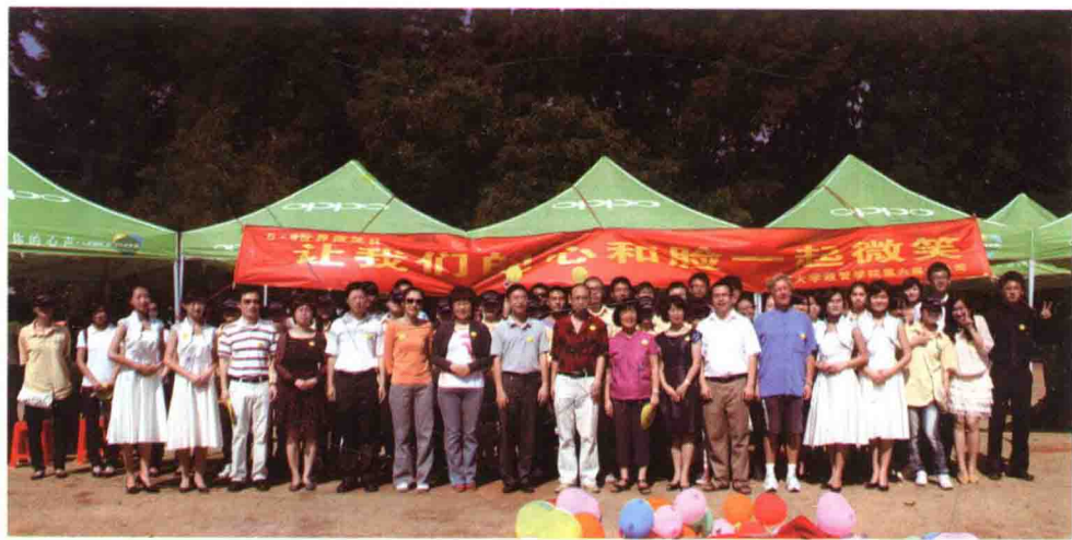
2006级公关专业在世界微笑日策划举办公关周活动

师恩难忘，将宝贵的人生经验馈赠； 师情悠长，为我们指引幸福的前程； 师爱无疆，震撼着心灵最柔软的地方。 章老师，我们爱您！我们祝福您！