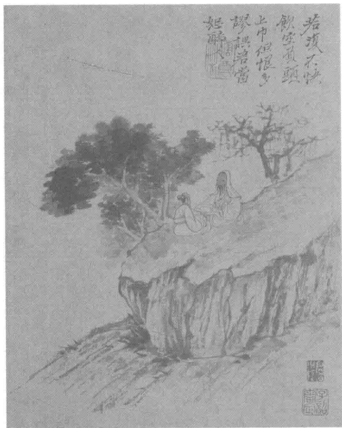
▲ 诗意图册 - 清 - 石涛 · 绘