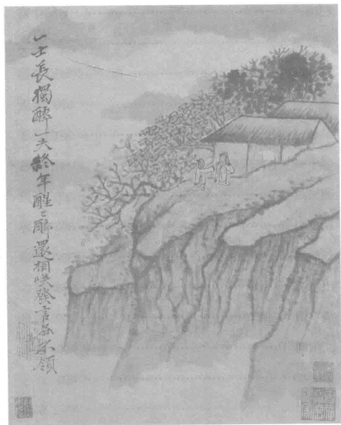
▲ 诗意图册—清—石涛·绘