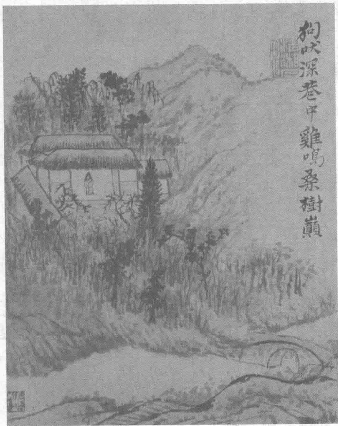
▲ 诗意图册—清—石涛·绘