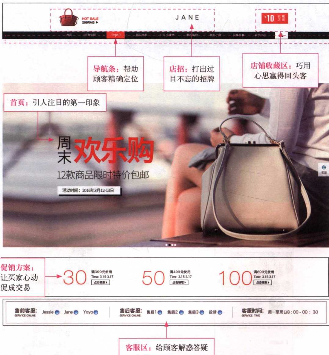
图 1-1 网店装修的整体基本规划

网店装修实际上就是通过整体的设计，将网店中各个区域的图像进行美化，利用链接的方式对网页中的信息进行扩展，如图 1-1 所示。