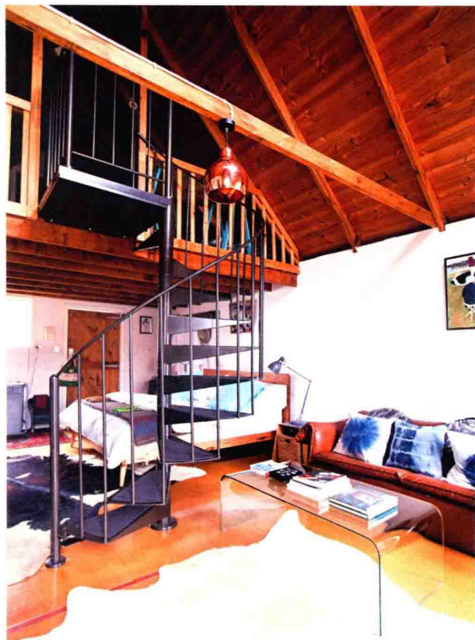
△ 铁艺楼梯与木质吊顶形成质感上的强烈反差

随着现代工业化的发展，北欧风格保留了自然、简单、清新的特点，不过，其空间设计形式还在不断的发展。现如今的北欧风格家居设计已不再局限于当初的就地取材，工业化的金属以及新材料也逐渐被应用到北欧风格的家居空间中。在时代的进程中，北欧人与现代工业化生产不仅没有形成对立，而且还采取了包容的态度，因此很好地保障了北欧风格的特性以及人文情怀。