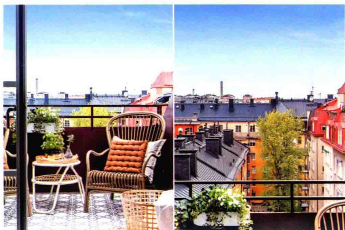
△ 北欧家居常用软装布置诠释出一种随性的生活态度