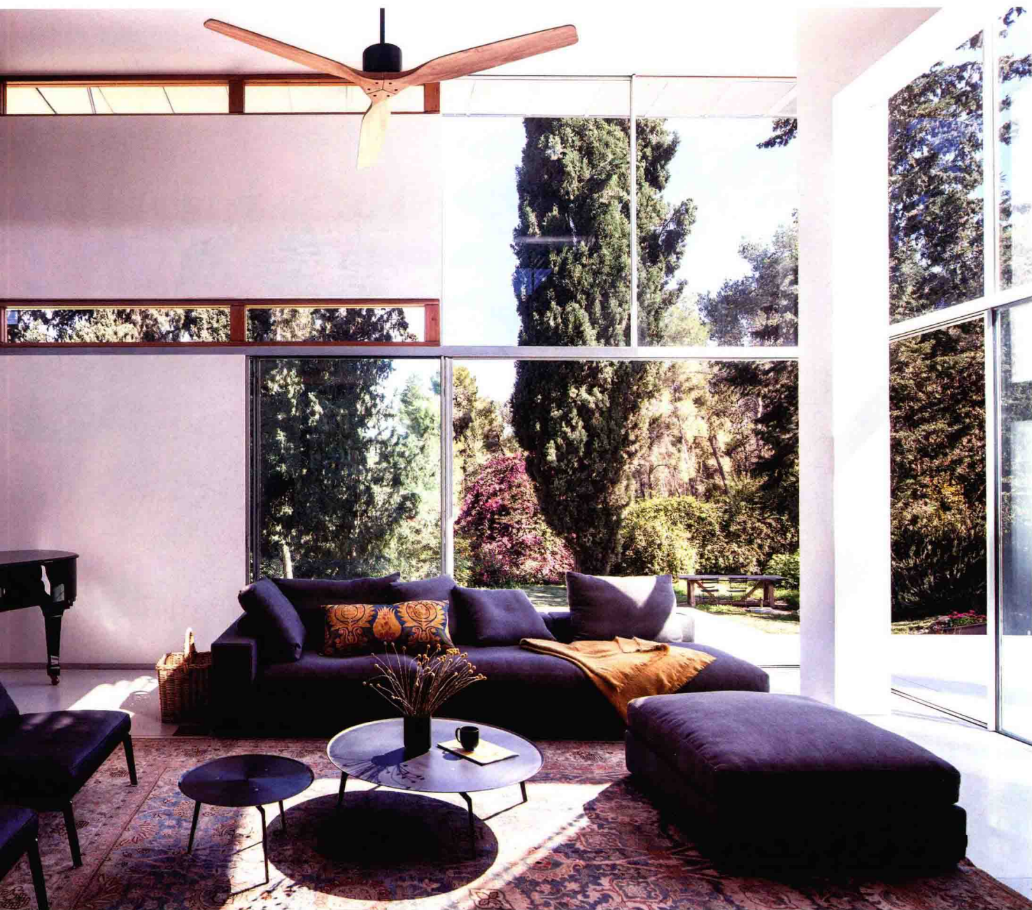
△ 通透简洁的空间结构设计

除实用功能外，北欧风格还善于利用材料自身的特点，展现出简约的设计美感以及以人为本的设计理念，摒弃了过于刻板的几何造型和浮华的无用装饰。此外，北欧风格的家居装饰还体现出了对传统元素的尊重、对天然材料的欣赏以及对空间装饰的理性与克制，并且在形式和功能上力求统一，表达出现代家居绿色环保和可持续发展的设计理念。