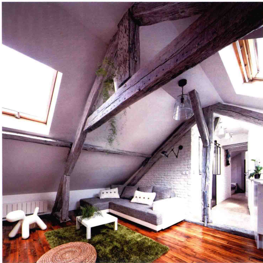
△ 尖顶和原木制成的梁

北欧风格家居通常不会做过多的固定式硬装。因为对于北欧风格来说，装修并不是主角，如何利用软装营造简单、随兴舒适的氛围才是关键。在北欧地区很多房子都是由砖墙建成，极富怀旧风情与历史气息。由于北欧地区雨雪天气较多，为防止积雪压塌房顶，其建筑都以尖顶、坡顶为主，而且室内常见原木制成的梁、檩、椽等建筑构件。此外，空间的顶、墙、地三面，一般不用纹样和图案装饰，而是用简单的线条以及色块点缀。