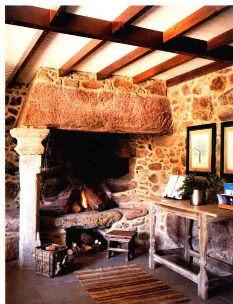
△ 质感粗犷厚重的毛石具有原生态的美感