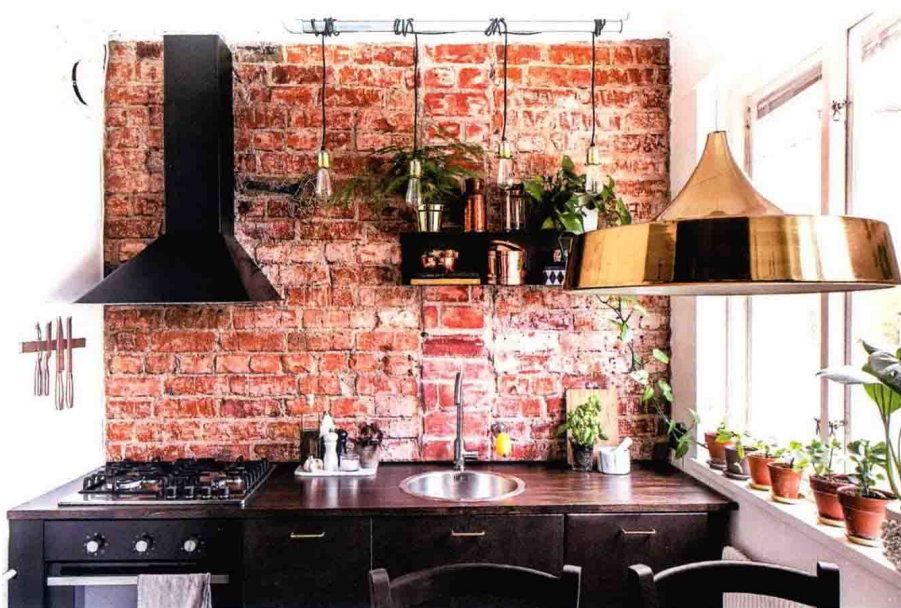
△ 不加修饰的砖墙尽显工业时尚的魅力

由于北欧地区气候严寒，人们长期生活在室内，造就了他们丰富且熟练的民族传统工艺。简单实用、就地取材以及大量使用原木与动物的皮毛，是早期北欧风格的特点。此外，北欧风格的家居设计注重人与自然、与环境有机地科学结合。常以木制家具为主，并且摒弃了复杂浮夸的设计，崇尚回归自然、返璞归真的精神。在软装搭配上，北欧风格对手工艺传统和天然材料都有着尊重与偏爱，而且在形式上更为柔和、自然，因此有着浓厚的人情味。