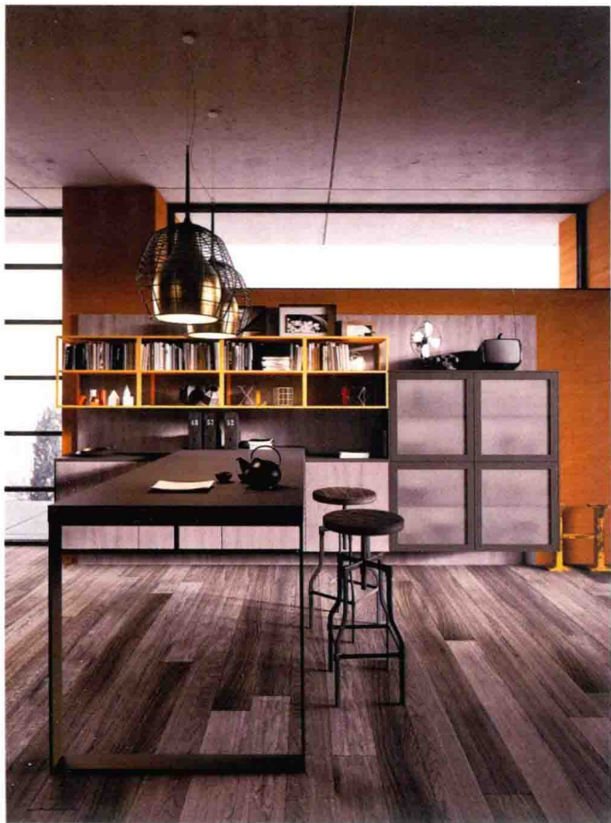
△ 金属元素在北欧空间中的运用