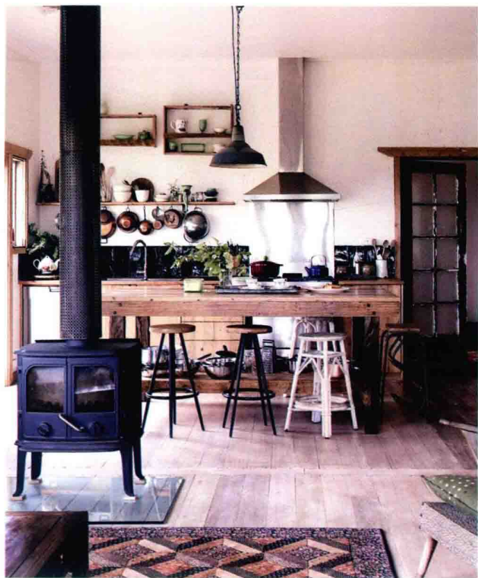
△ 工业矿灯搭配铁木结合的吧凳

随着现代工业化的发展，北欧风格保留了自然、简单、清新的特点，不过，其空间设计形式还在不断的发展。现如今的北欧风格家居设计已不再局限于当初的就地取材，工业化的金属以及新材料也逐渐被应用到北欧风格的家居空间中。在时代的进程中，北欧人与现代工业化生产不仅没有形成对立，而且还采取了包容的态度，因此很好地保障了北欧风格的特性以及人文情怀。