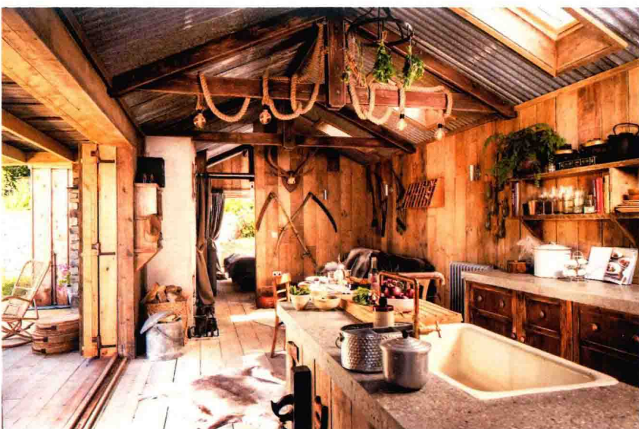
△ 大量使用原木与动物的皮毛作为空间的装饰元素