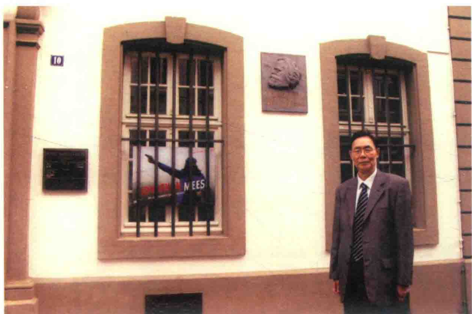
在特里尔马克思故居门前，摄于2007年6月10日