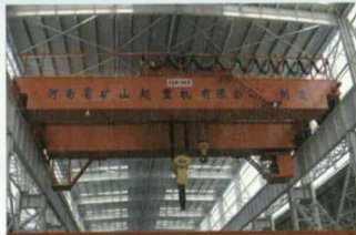
QD型电动双梁桥式起重机