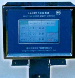
LX型起重力矩限制器