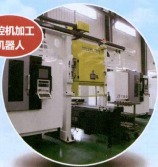
数控机加工机器人