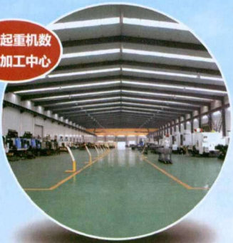
新型起重机数控机加工中心