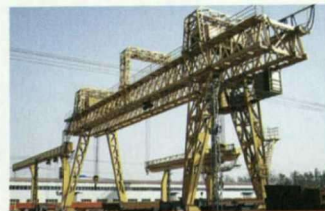
MG型双梁桁架门式起重机