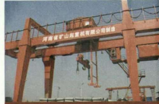
MG型地铁施工门式起重机