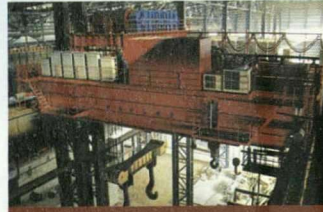
YZS型铸造桥式起重机