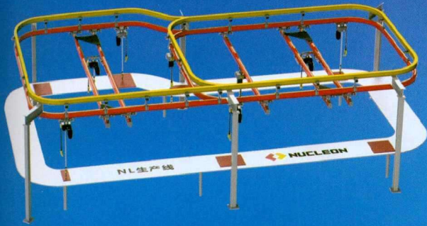
● 轻量化柔性组合式起重机