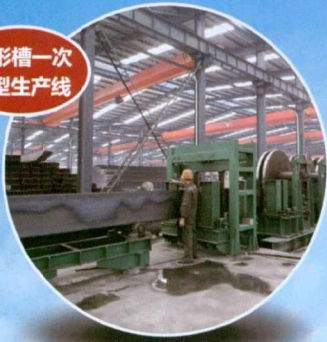
U形槽一次成型生产线