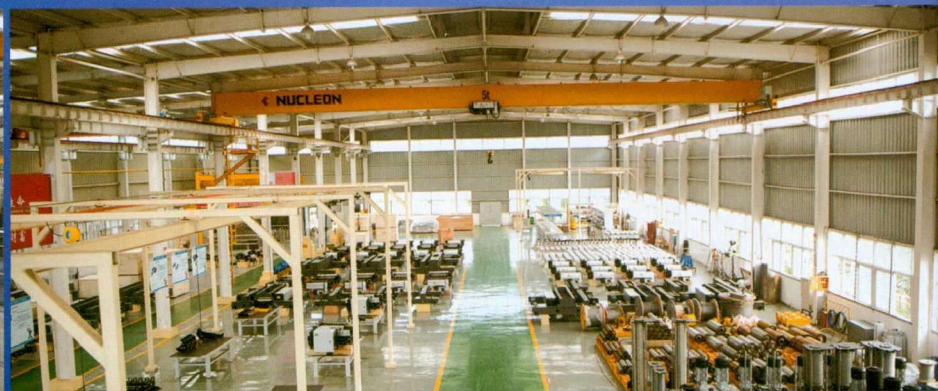
新型葫芦装配车间