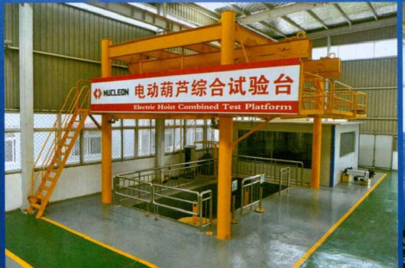
电动葫芦综合试验台