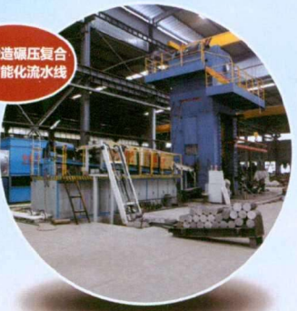
车轮锻造碾压机复合工艺智能化流水线