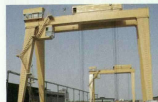
MG双主梁小车通用门式起重机