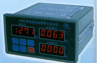
GDQ型高度起重量综合仪