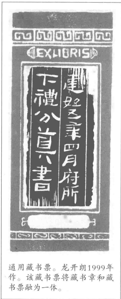
通用藏书票。龙开朗1999年作。该藏书票将藏书章和藏书票融为一体。