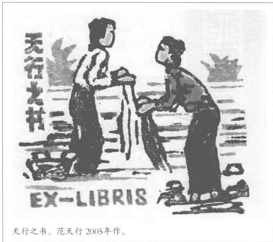
天行之书。范天行 2005 年作。

于它的收集，就和邮票一样，漫无止境。而藏书章，却因形式上的限定，除字句变动外，几乎保持固定的格式，它依附书籍而存在，收藏不便。因此收藏藏书票成为潮流，专门收藏藏书票的收