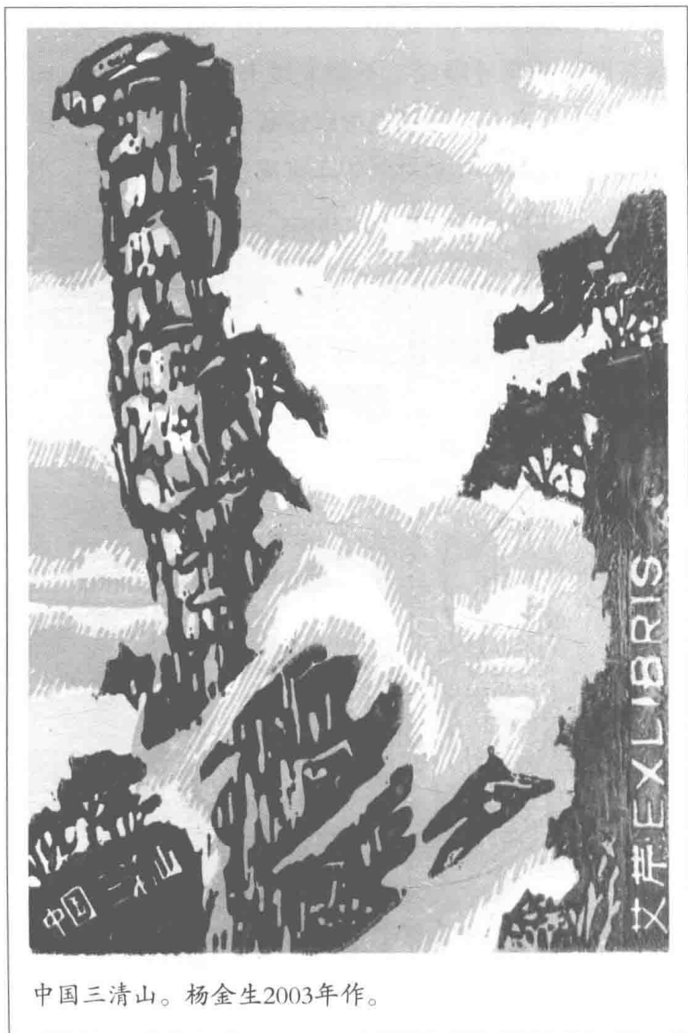
中国三清山。杨金生2003年作。