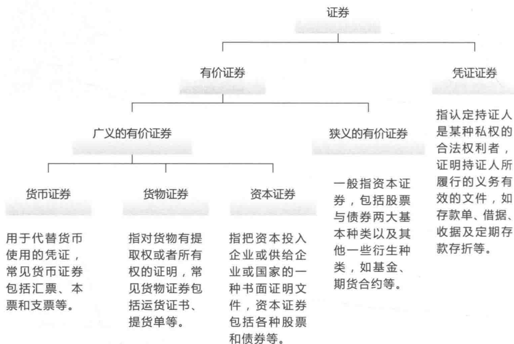
图 1-1 证券的分类

根据性质的不同,可以将证券分为有价证券和凭证证券两种,其具体包含的内容如图 1-1 所示。