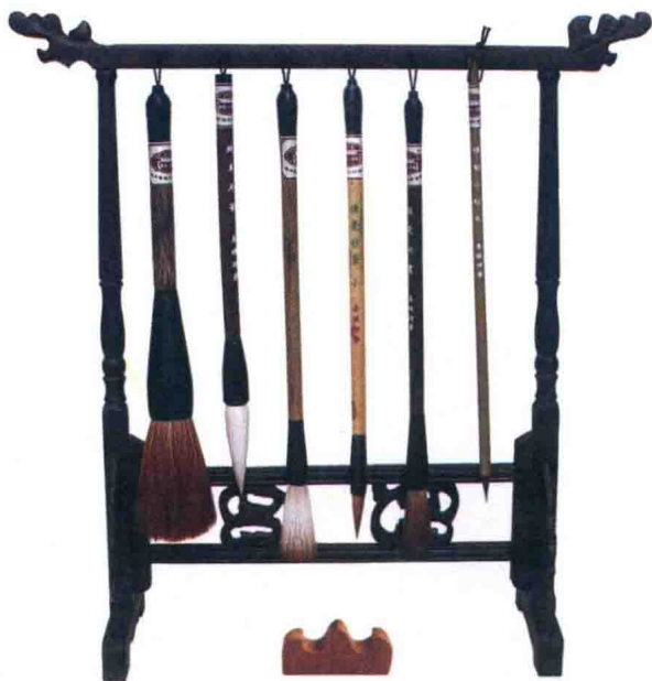
将毛笔倒挂在笔挂上

对于毛笔的使用和保护，须注意的是，用毕后一定要清水洗净、将水吸干后倒挂在笔挂上，或放在笔筒里让其自然晾干。切勿用后不洗，就搁置一旁，等下次作画时，若将干笔浸入盂中用力净洗，必将使毫锋折断，损坏了笔毫。新购置的毛笔，毫锋尖细整匀，最宜画工笔和兼工带写的画作。