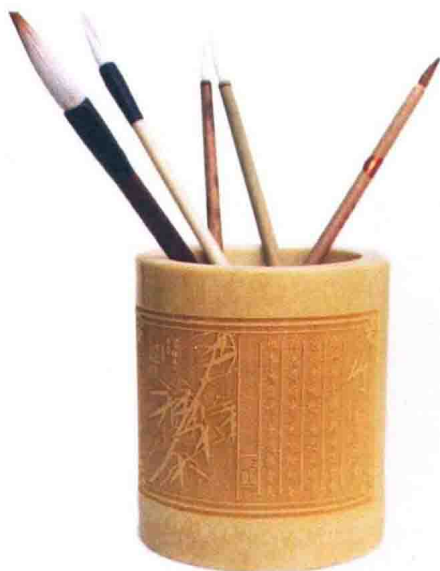
将毛笔放在笔筒里让其自然晾干