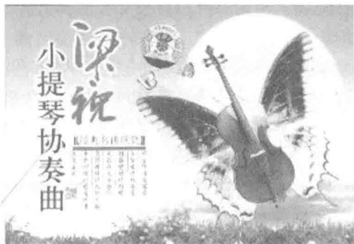
陈钢、何占豪小提琴协奏曲《梁祝》唱片封面

绘画艺术也是如此。绘画的形式因素包括色彩、线条、体面、明暗等,但是并非色、线、形等形式因素的任意排列组合就能成为绘画艺术。只有将这些形式因素,按照一定的规则排列组合,构成有意味的形式后才能够感染人,才能够激发人的审美情感,引发人们的共鸣,否则,都不能够称其为绘画艺术。即使现代主义美术流派在形式上看起来无序可循,但其中无不存在规则,无不是通过大胆想象来表现丰富的意味的。事实上,不仅音乐、绘画,而且文学、舞蹈、戏剧、影视等艺术门类,也都具有一定的规则形式,也都是表达情感和意义的有意味的规则形式系统。