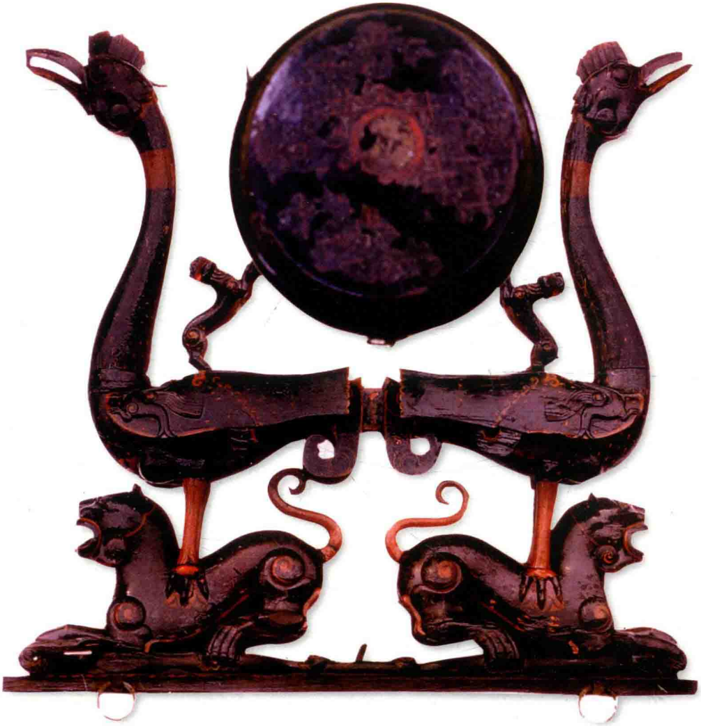
[战国] 虎座鸟架鼓，湖北九连墩楚墓出土。选自陈中行等《漆器保护脱水技术》