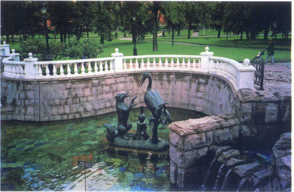
В парке Москвы