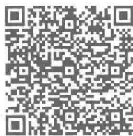
视频链接：物流的认知

物流概念最早诞生于美国。1905年，美国少校琼西·贝克（Major Chauncey B. Baker）提出并解释了Logistics（后勤学），但它主要应用于军事领域。1915年，美国经济学家阿奇·萧在《市场流通中的若干问题》（ Some Problems in a Market Distribution ）一书中提出：“物流是与创造需求不同的一个问题”，并提到“物质经过时间和空间的转移，会产生附加价值”。这里物质的时间和空间的转移后被称为实物流通。20世纪30年代，美国出版的教科书《市场营销的原则》中涉及了“实物供应”（Physical Supply）这一概念，并将市场营销定义为“影响产品所有权转移和产品实物流通的活动”。该定义所指的实物流通与现代物