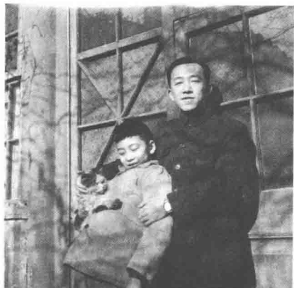
1959年冬与父亲在北房门前