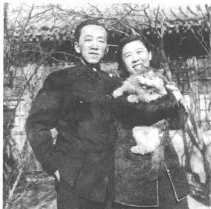
1959年冬父亲、母亲与“大姐姐”