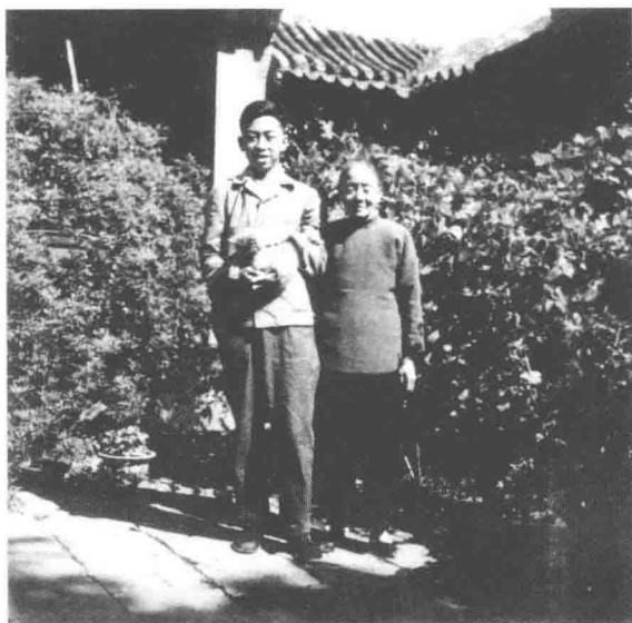
1963年与老祖母在四条院内