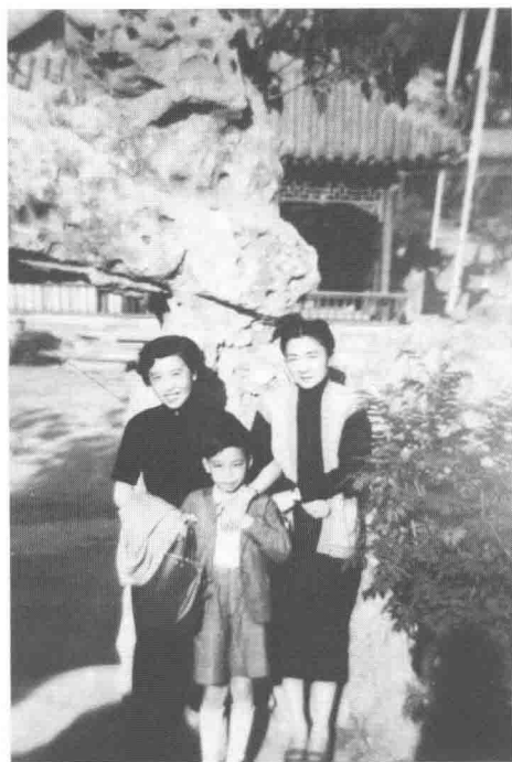
1956年春与祖母、母亲在中山公园