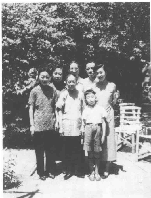
1957年夏在二条院内。左起：祖母、姑姑、老祖母、伯母、父亲、母亲