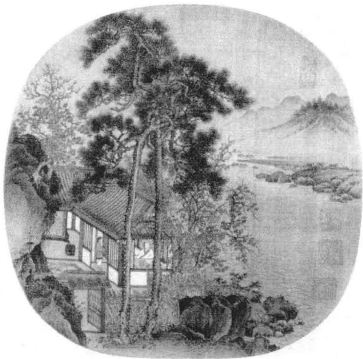
秋窗读易图 南宋 刘松年

《诗》《书》《礼》《易》《春秋》合称“五经”，《易》书有“群经之首”的美誉，博大精深，可称中国古代哲学之源头。《秋窗读易图》展示了山水掩映的书斋中，小童立侍一旁，主人在书案前沉思，似在品味《易》之奥妙的场景。