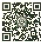
厦门大学出版社 微博二维码