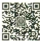
厦门大学出版社 微信二维码