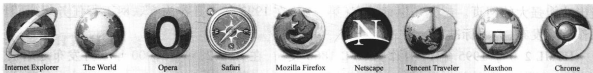
图 1-3 常见的 Web 浏览器

个人计算机上常见的网页浏览器包括微软的 Internet Explorer、Mozilla 的 Firefox、Apple 的 Safari、Opera、Google Chrome、GreenBrowser 浏览器、360 安全浏览器、搜狗高速浏览器、天天浏览器、腾讯 TT、傲游浏览器、百度浏览器、腾讯 QQ 浏览器等。浏览器是最经常使用的客户机程序。常见浏览器的图标如图 1-3 所示。