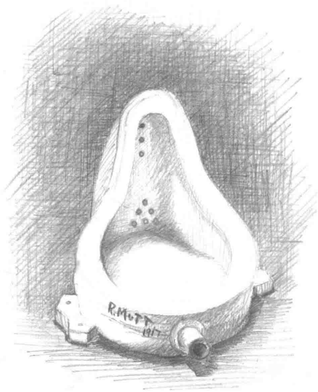
模仿马歇尔·杜尚（Marcel Duchamp）作品，《喷泉》，1917年