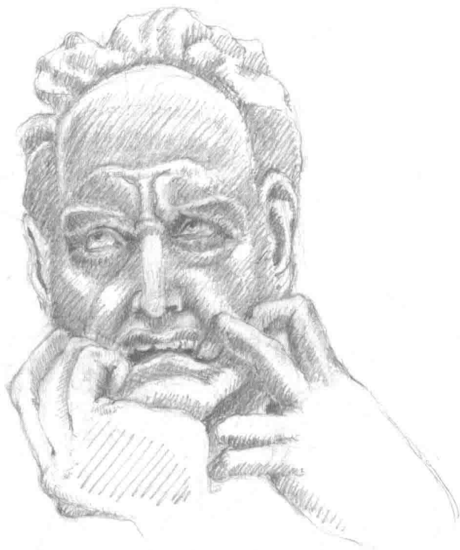
模仿让-巴蒂斯特·卡尔波（Jean-Baptiste Carpeaux）作品，《乌格里诺》，1860—1862年