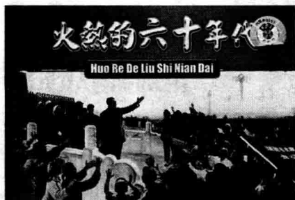
◇革命火热激情年代

力宣传“全心全意为人民服务”的共产主义思想道德，团组织提倡和组织青少年学习革命前辈的光荣传统和模范事迹。同时，各级党组织大力加强思想政治工作。这一切都强有力地净化了社会环境，使社会