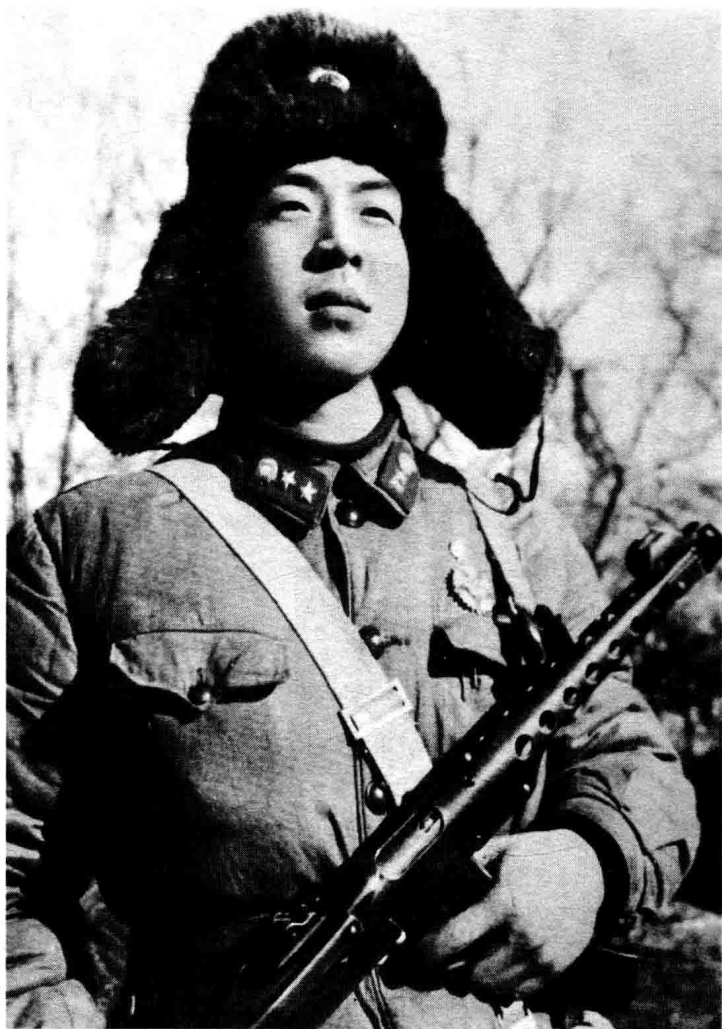
◇伟大的共产主义战士——雷锋

雷锋，一个不朽的名字；雷锋，一个平凡而又崇高的人物，他的音容笑貌虽然化为历史繁星，但是他全心全意为党、为国家、为人民服务的精神，永远散发着人性的伟大光芒。雷锋精神，一面永远不倒的旗帜；雷锋精神，一座人类灵魂的丰碑。作为一种时代的财富，它早已深深融入了每个人的心中，伴随着人类社会的发展愈发显现出其巨大价值。