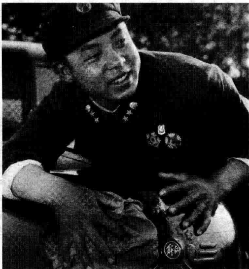
◇毛主席的好战士——雷锋

伟大的雷锋精神，孕育和诞生在20世纪60年代初期，是雷锋同志一生感人事迹的光辉写照，是中华民族传统美德的集中反映，是社会主义道德的本质要求，是中国共产党人的先进性和社会主义核心价值体系的生动展现。