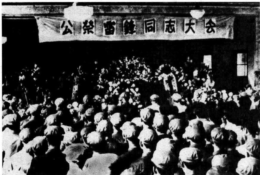
◇公祭雷锋同志大会在抚顺市望花区政府礼堂举行