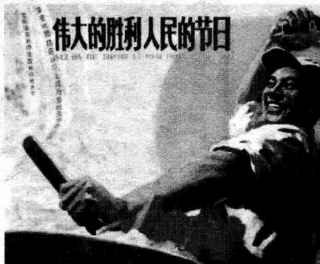
◇革命火热激情年代

1956年，中国完成了生产资料的社会主义改造，建立在公有制基础上的集体经济，决定了人们思想观念上的更新。在革命和建设的实践中，马克思列宁主义和毛泽东思想的指导地位也在我国人民群众中逐步确立起来。社会主义的经济、政治、文化条件的确立，极大地改变了中国人民的精神面貌。一个社会主义的中国屹立在东方，以崭新的面貌出现在世界民族之林。