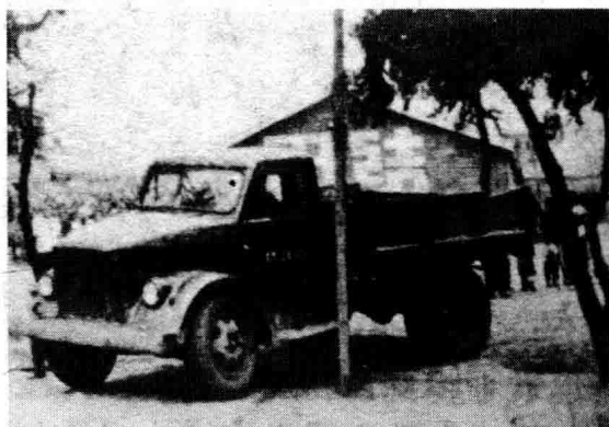
◇汽车撞倒柞木方柱的场景

1960年，雷锋参军入伍，由于他学习刻苦，工作努力，入伍头一年就荣记二等功、三等功各一次，并光荣加入了中国共产党；当年11月，他为灾区和人民公社捐款以及艰苦奋斗、刻苦学习、助人为乐等先进事迹，由沈阳军区《前进报》以长篇通讯《毛主席的好战士》报