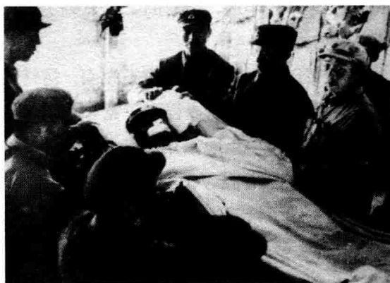
◇雷锋心脏停止了跳动

道后，在社会上引起强烈反响，沈阳军区工程兵党委做出授予雷锋同志“模范共青团员”称号的决定，沈阳军区工程兵政治部发出《关于在部队中开展学雷锋、赶雷锋运动的指示》。1961年1月14日，中央军委工程兵政治部发出《关于学习雷锋同志的通报》。当年，雷锋晋升为班长，并被选为抚顺市人民代表。