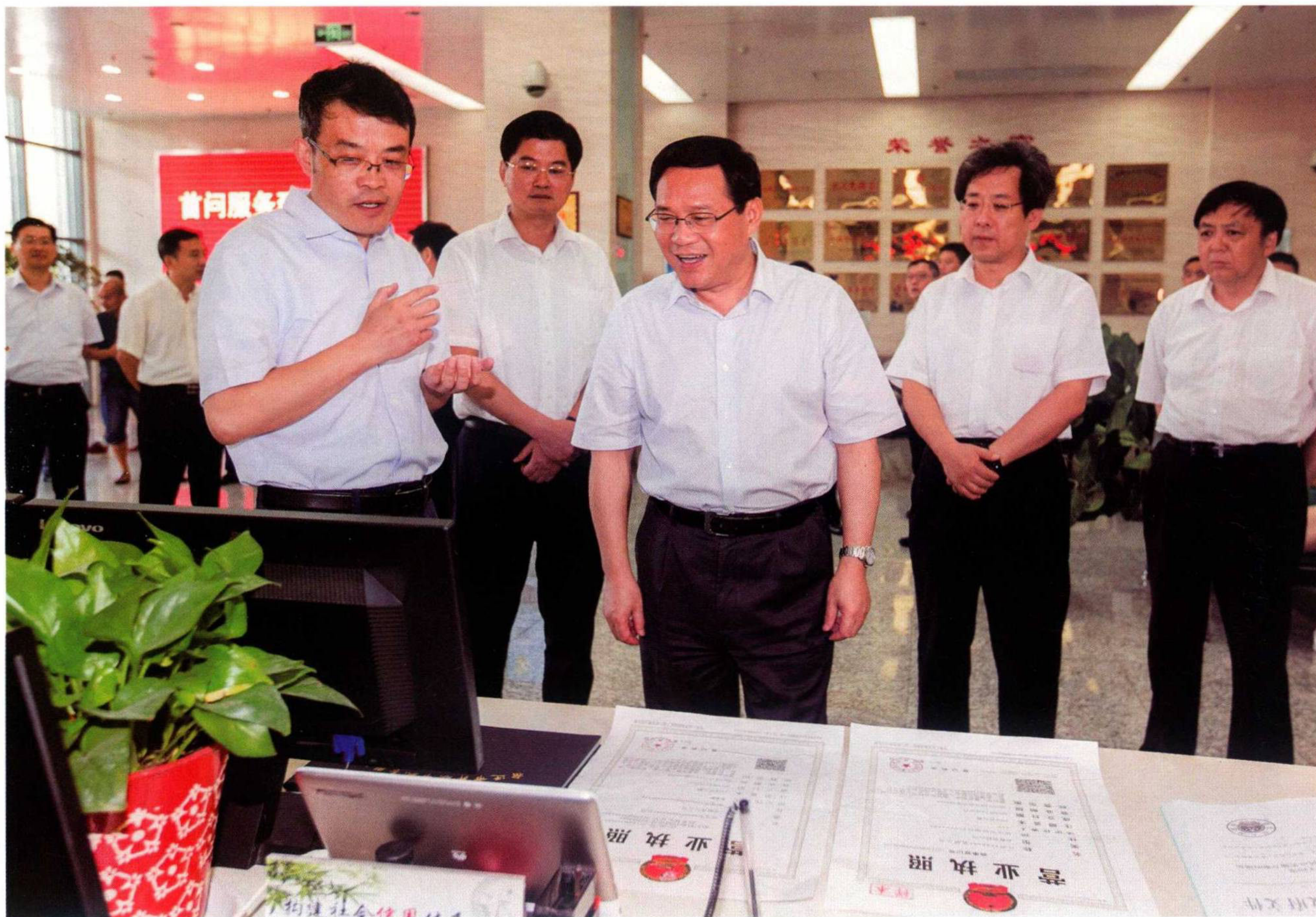
7月25日,省委书记李强(前排中)调研宿迁市商事制度改革工作