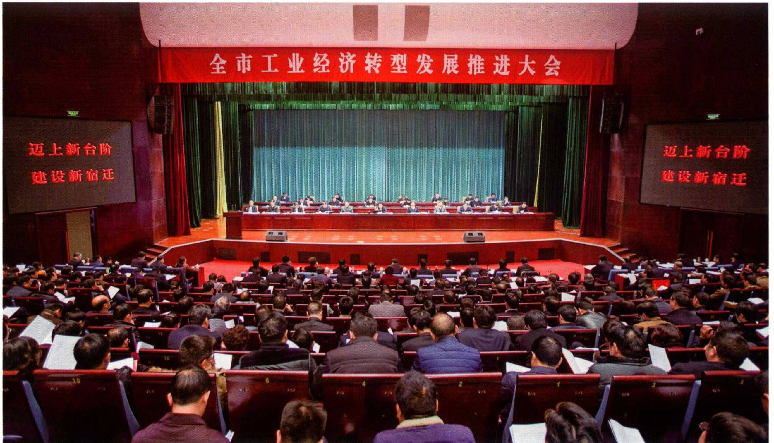
2月27日,全市工业经济转型发展推进大会召开,会议要求全市上下强化“以工兴市、产业强市”第一方略不动摇,进一步突出项目、聚焦工业、矢志转型,全力推动工业经济迈上新台阶,努力实现“十三五”工业经济发开展开门红。