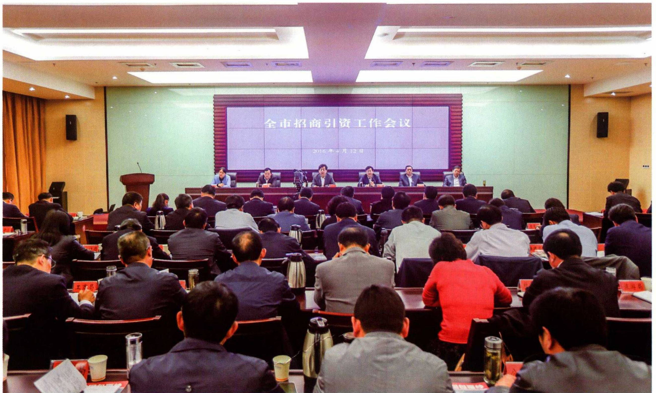
4月12日,全市招商引资工作会议召开,市委副书记、市长王天琦在讲话中强调,在经济新常态下,招商引资工作要顺应供给侧结构性改革的需要,克服过去招商的惯性思维,以供给侧结构性改革引领招商引资转型升级。