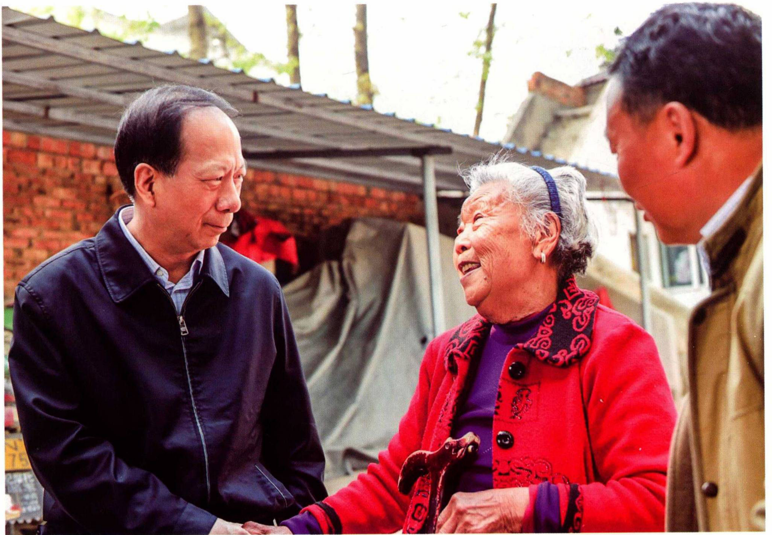
4月12—16日，省委副书记、省长石泰峰（左一）在泗阳县李口镇八堡村驻村调研