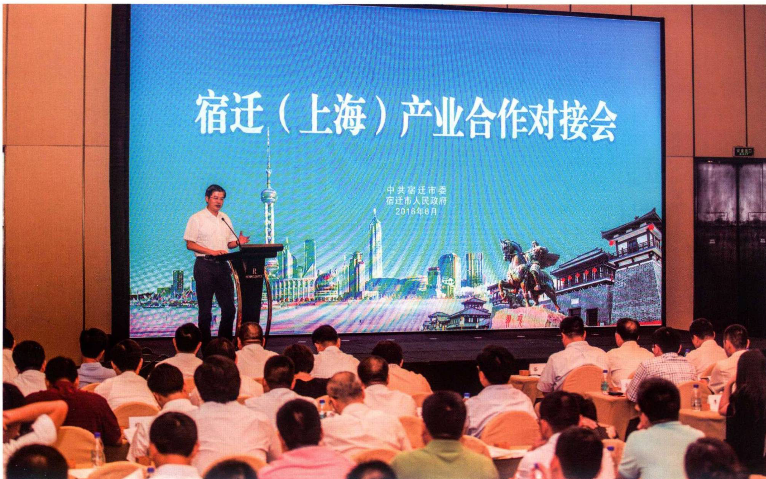
8月23日，市委书记、市人大常委会主任魏国强在宿迁（上海）产业合作对接会上致辞。