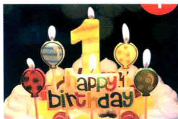
처음 初次, 第一次