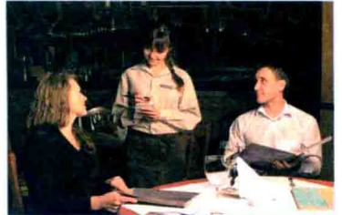
시키다 点 (菜)