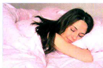
꿈을 꾸다 做梦