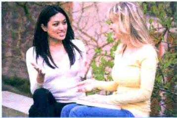
이야기 故事, 谈话