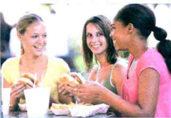
식사 吃饭, 用餐