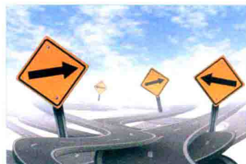
길을 잃어버리다 迷路