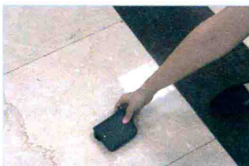
지갑을 줍다 捡钱包