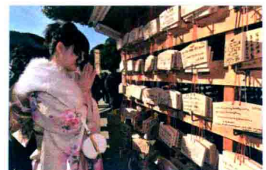
소원 愿望, 心愿