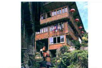
고향 故乡, 老家