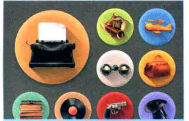
물건 物品, 东西