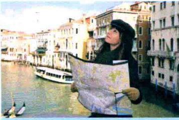
구경하다 游阅, 观赏