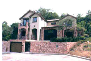
택 宅, 府上