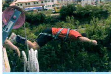
번지 점프 蹦极