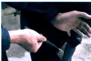
소매치기를 당하다 遇到扒手