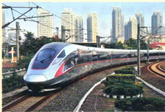
“复兴号”动车组列车

那么，中国高铁是如何进行运输组织与经营管理的？就让我们一起走进中国高铁运营组织与管理的台前幕后。