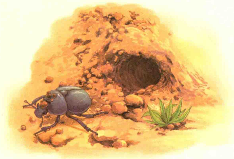
蓝蒂菲粪金龟会利用背部的背脊把圆球粪金龟挖出的泥土运出洞外。

保护措施。可蒂菲粪金龟为宝宝准备的房子却完全不是这样的，这里看上去既简陋又粗糙，像个废弃的沙堆。幼虫宝宝诞生在一个与食物相隔一段距离的硬床上，必须穿过厚厚的沙土层才能吃到食物。蒂菲粪金龟母亲能够将坚硬的粪便制成柔软的美食，却不知道如何为宝宝搭建一个柔软舒服的小窝。