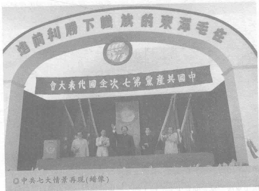
◎中共七大情景再现(蜡像)

会。其中，中央委员会委员 44 人，候补中央委员 33 人。6 月 19 日七届一中全会选举出 13 名中央政治局成员，选举了毛泽东、朱德、刘少奇、周恩来、任弼时为中央书记处书记，毛泽东为中央委员会主席、中央政治局主席、中央书记处主席。