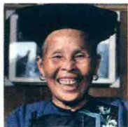
Hunan Xiangxi Shibadong De Gushi