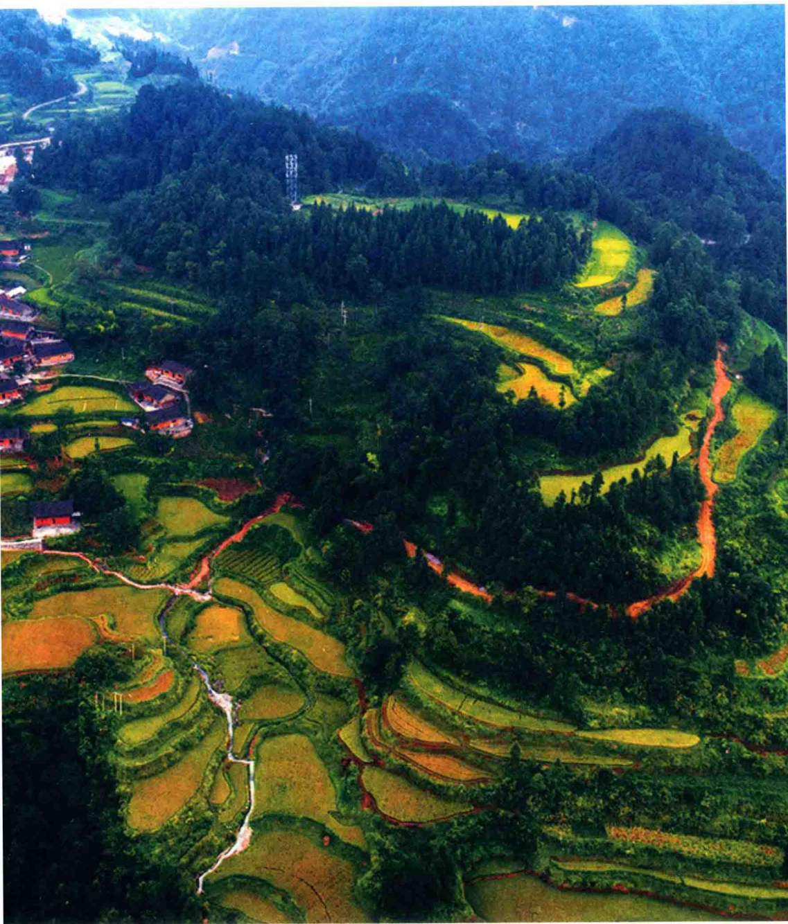
生机勃勃的十八洞，打翻了各种油彩和图画，明媚斑斓，次第铺展。