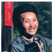
Hunan Xiangxi Shibadong De Gushi

十八洞是湖南湘西的一个苗族村落。因村落里有十八个山洞而得名。十八洞是因为习近平总书记的到访而声名远播的。