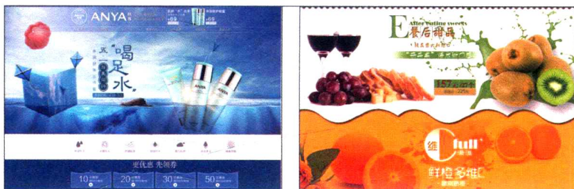
图1-7 冷色调和暖色调的对比