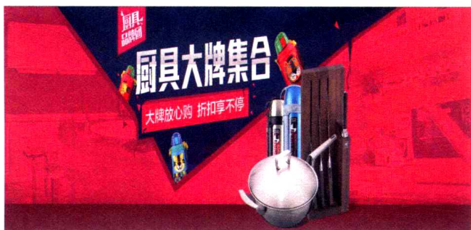
图1-8 色彩面积的对比