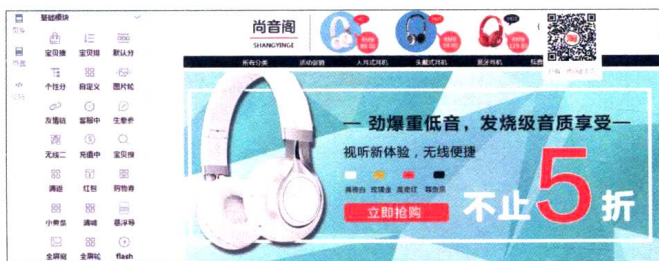
图1-2 店铺的部分基础模块和店铺首页的部分装修效果