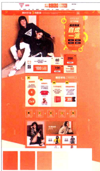
图1-5 不同明度的对比效果