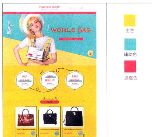
图1-9 主色、辅助色与点缀色

网店美工在搭配店铺的页面色彩时不能随心所欲，需要遵循一定的比例与程序。网店装修配色的黄金比例为“70：25：5”，其中，主色色域占总版面的70%，辅助色占25%，而其他点缀色占5%。网店装修的配色程序为：首先根据店铺类目选择占用大面积的主色，然后根据主色合理搭配辅助色与点缀色，用于突出页面的重点、平衡视觉效果。图1-9所示为主色、辅助色与点缀色的应用案例。