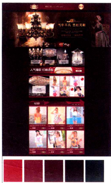
图1-6 不同纯度的对比效果