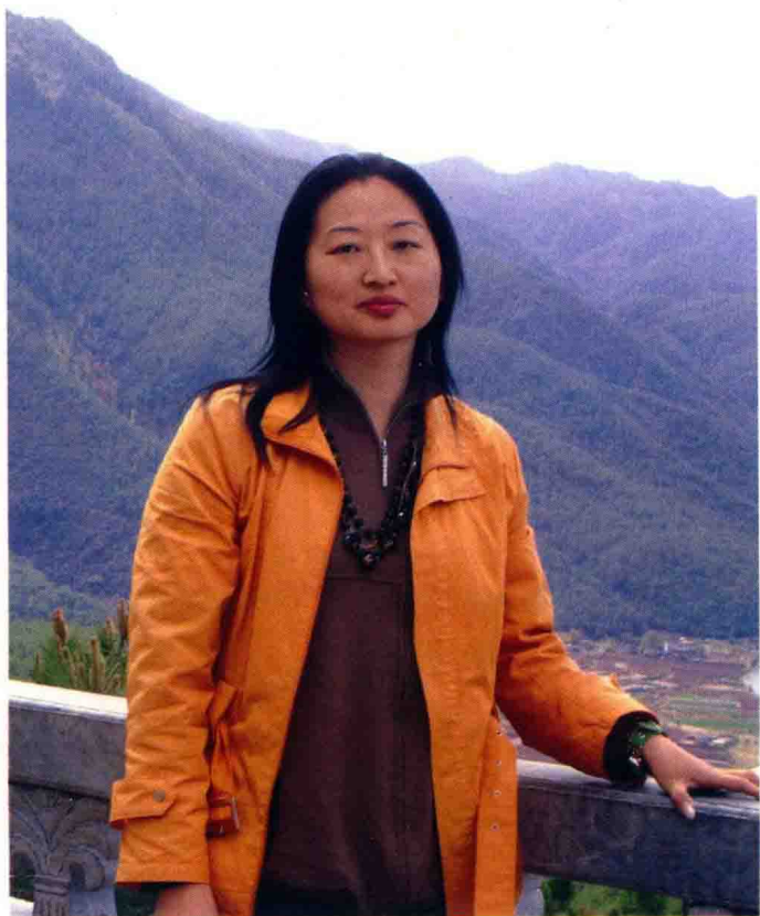
作者在去往泸沽湖的山间留影