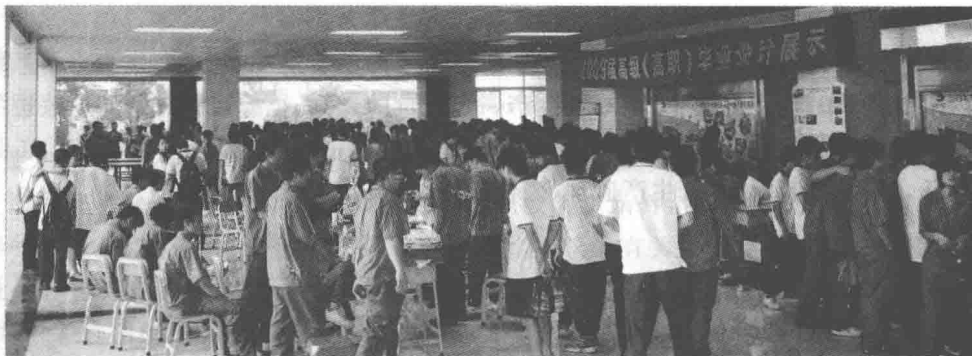
图 0-1 毕业设计展示场面