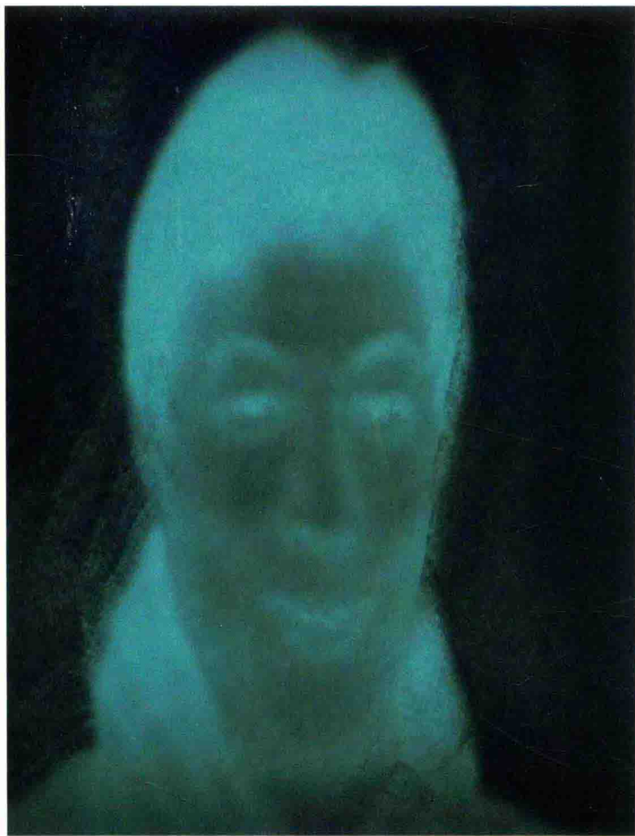
金江波：《意识的殿堂》，影像，2012

封面：张大力：《100个中国人》（局部），2001-02， 北京公社画廊展览，2005年7月