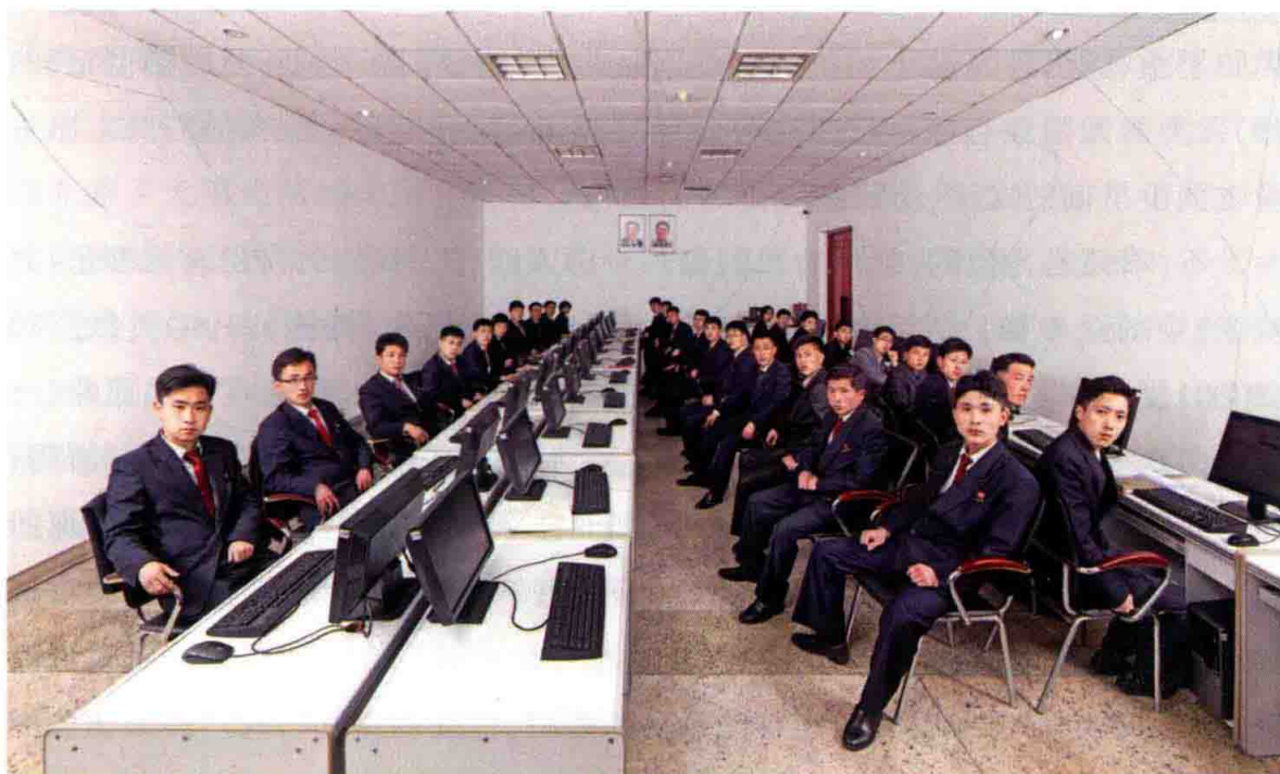
王国峰：《朝鲜2014-金策工业综合大学的大学学生们》，摄影，294×180cm，2014