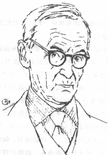
赫尔曼·黑塞 (高莽 作)