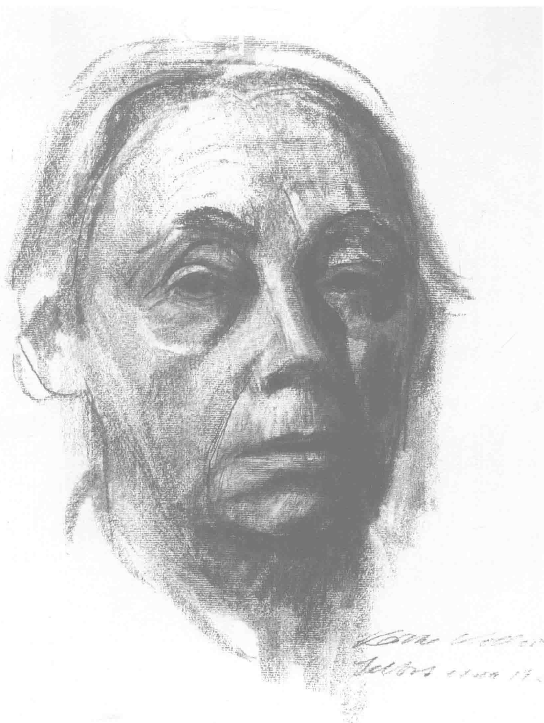
自画像 1927年 粉笔 31.4cm×24.6cm