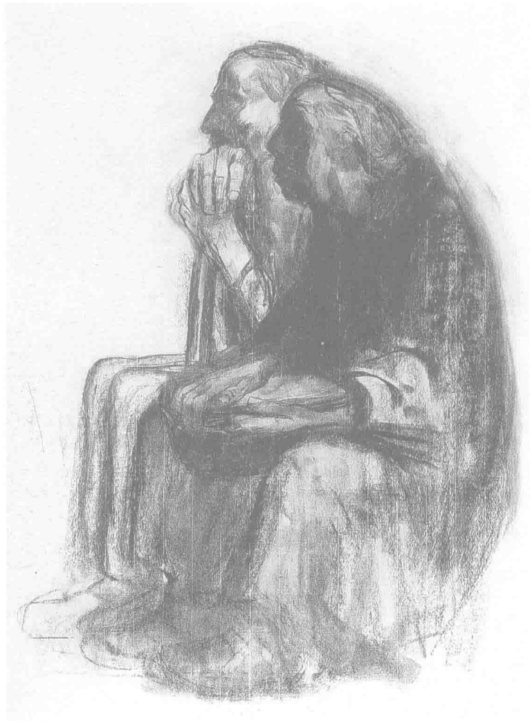
夫妇 炭笔 65.5cm × 47.8cm (局部右页)