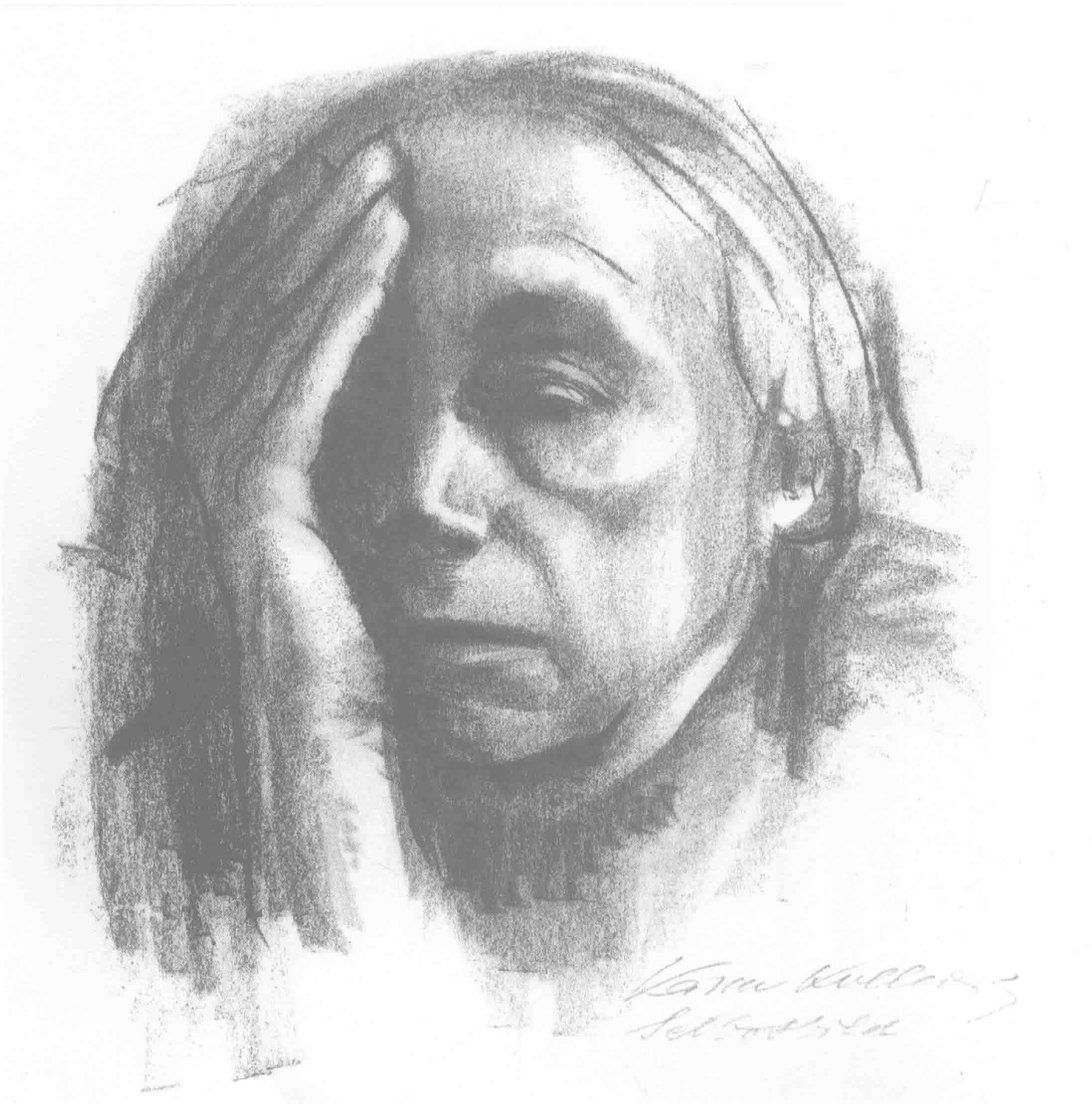
自画像 1925年 粉笔 38.1cm × 25.4cm