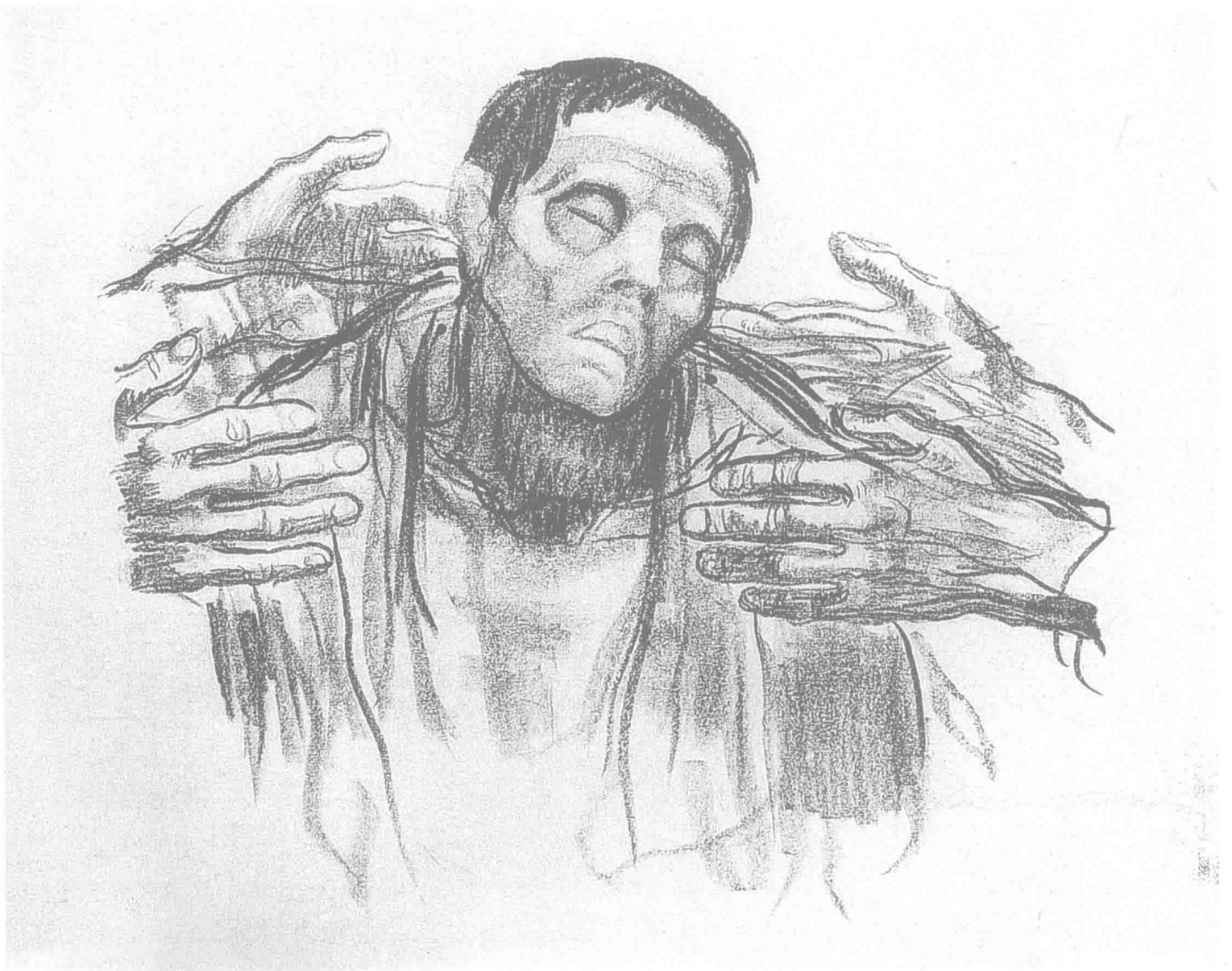
贫穷 1912年 炭笔