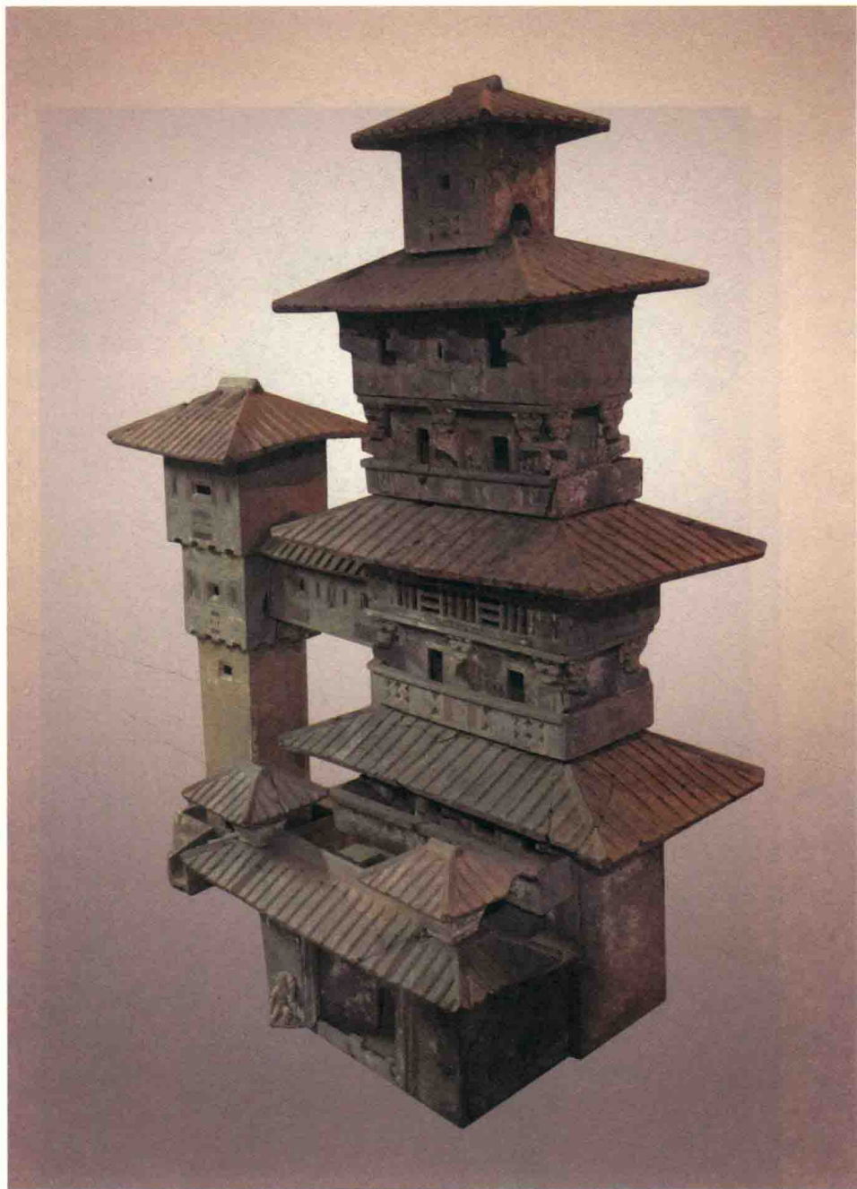
图六 七层连阁式陶仓楼