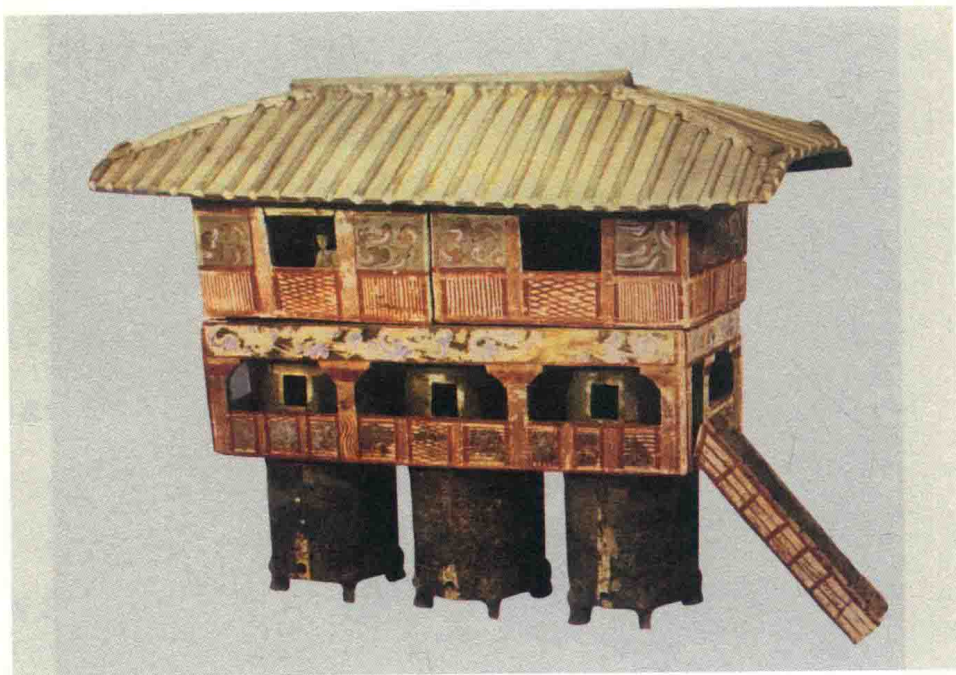
图二 三联仓陶仓楼