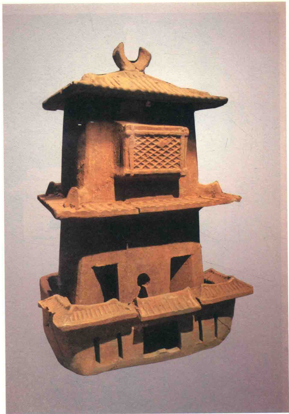
图五 泥质灰陶陶楼