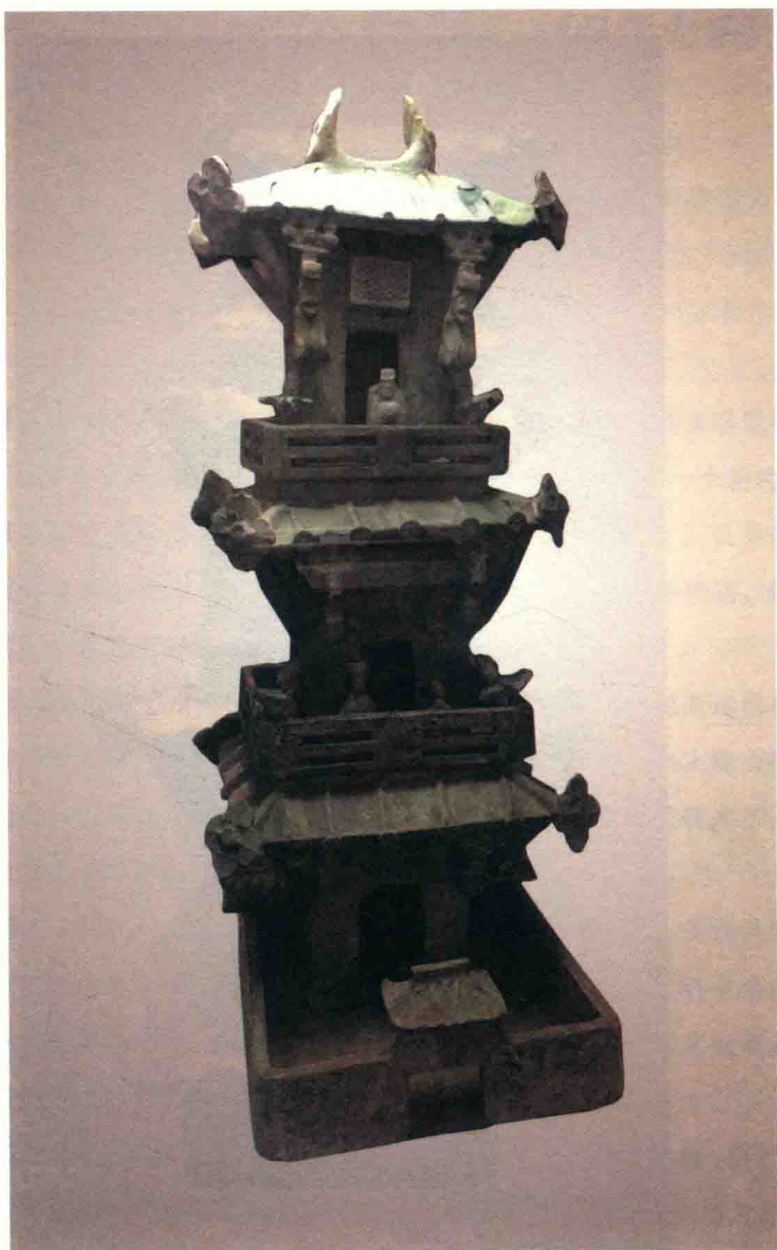
图八 绿釉三层陶楼