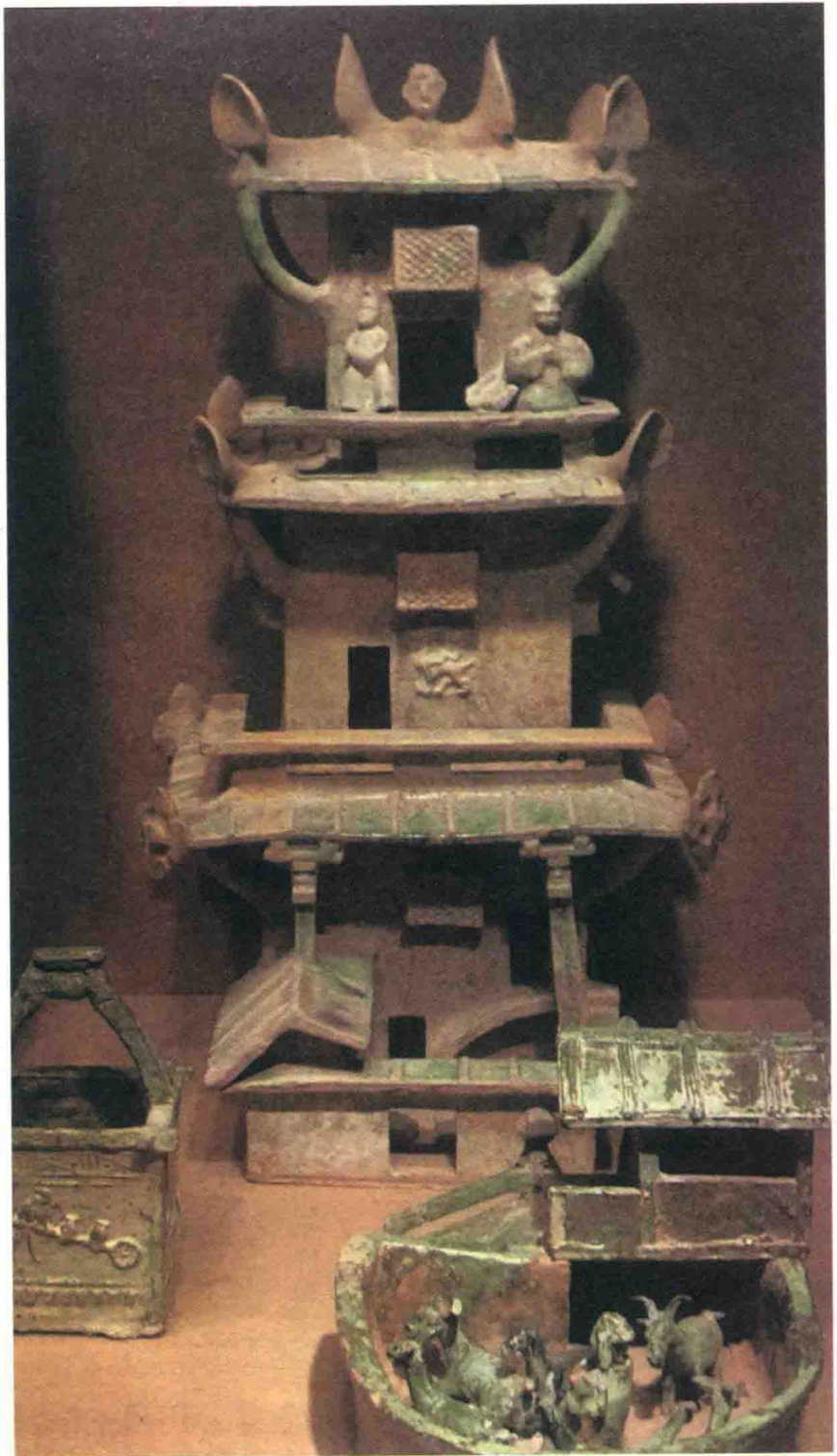
图一 绿釉陶楼