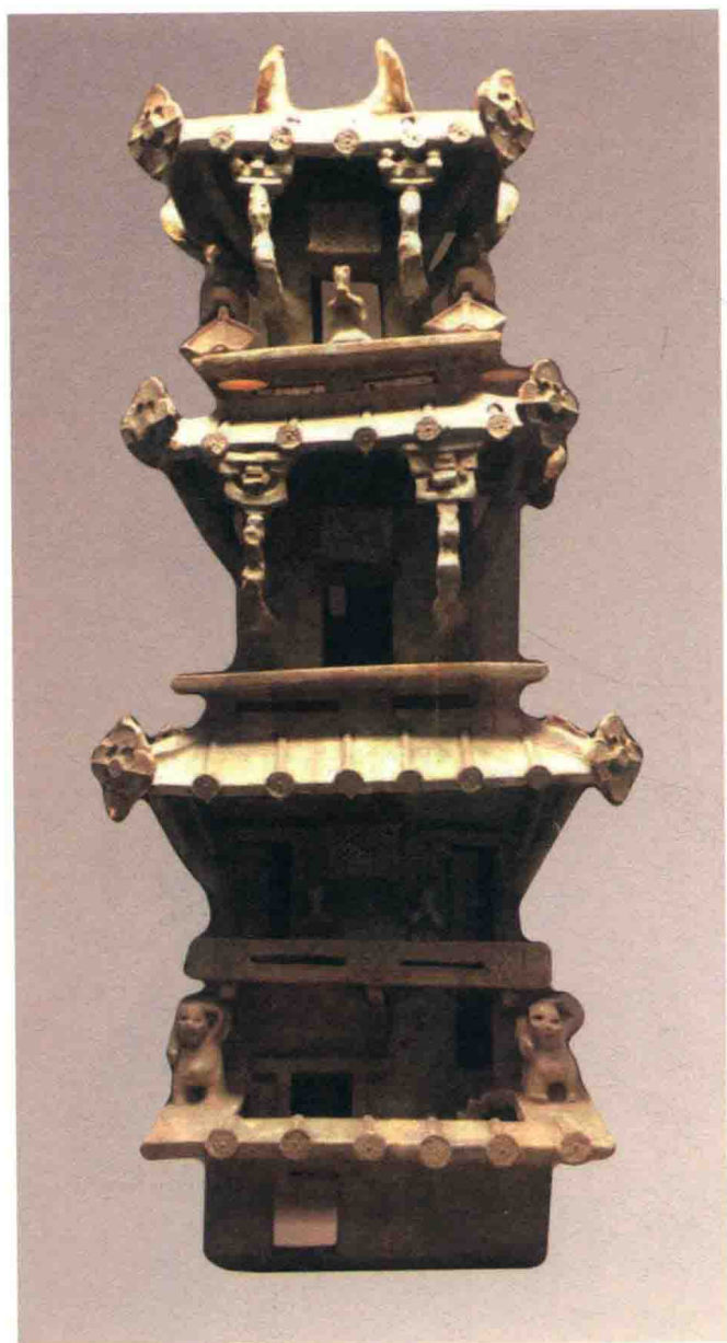
图九 绿釉四层陶楼