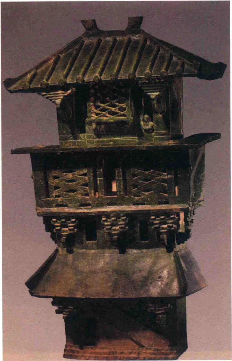
图七 绿釉陶楼