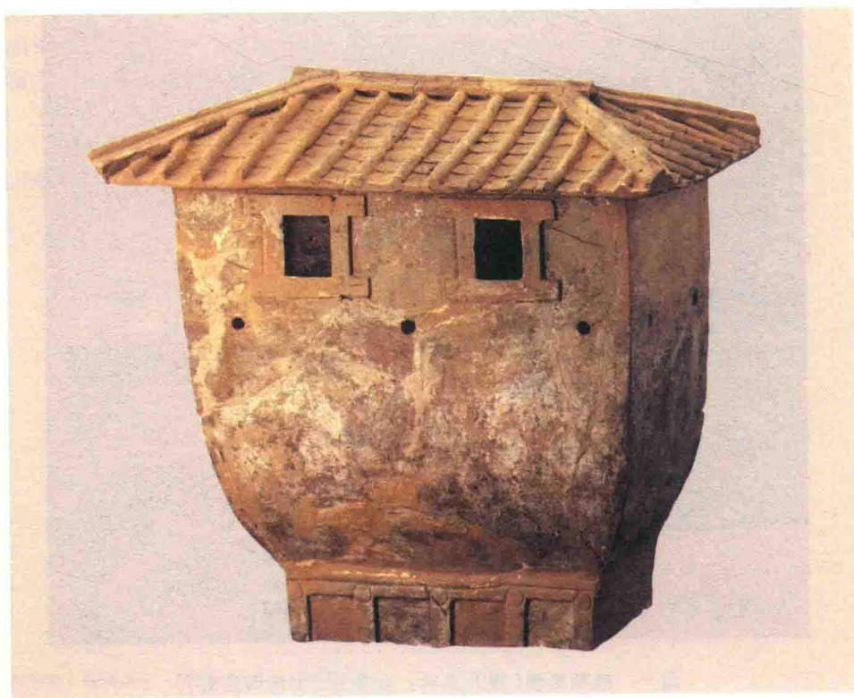
图三 四坡房屋形陶仓