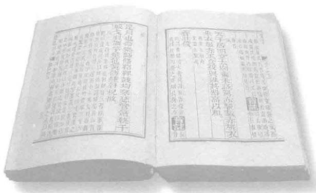
▲《大学》原是《礼记》第四十二篇；《中庸》原是《小戴礼记》第三十一篇