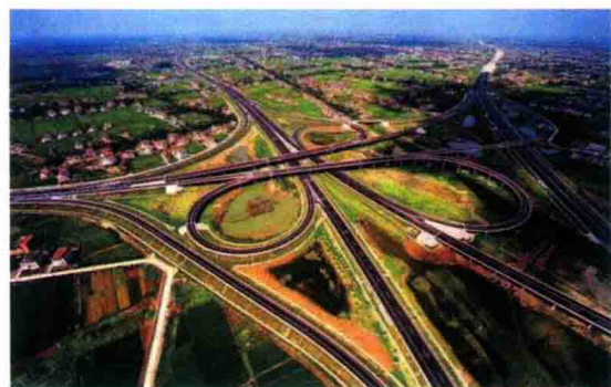
四通八达的罗定交通 / 新闻图片