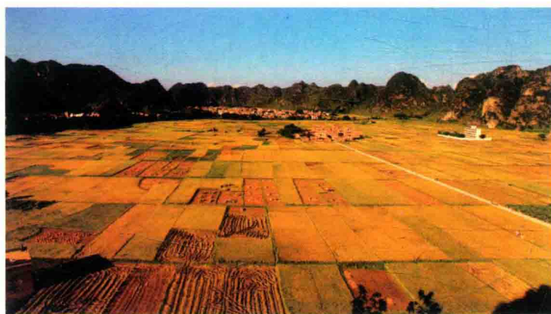
美丽稻田