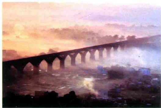
长岗坡渡槽