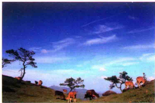
八排山风光