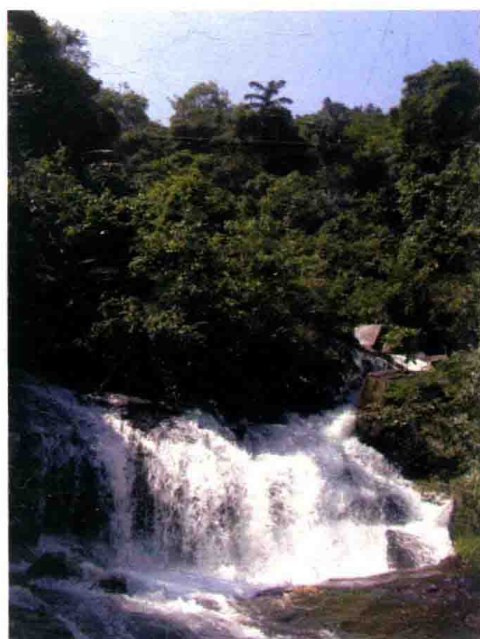
连州蒲垌瀑布