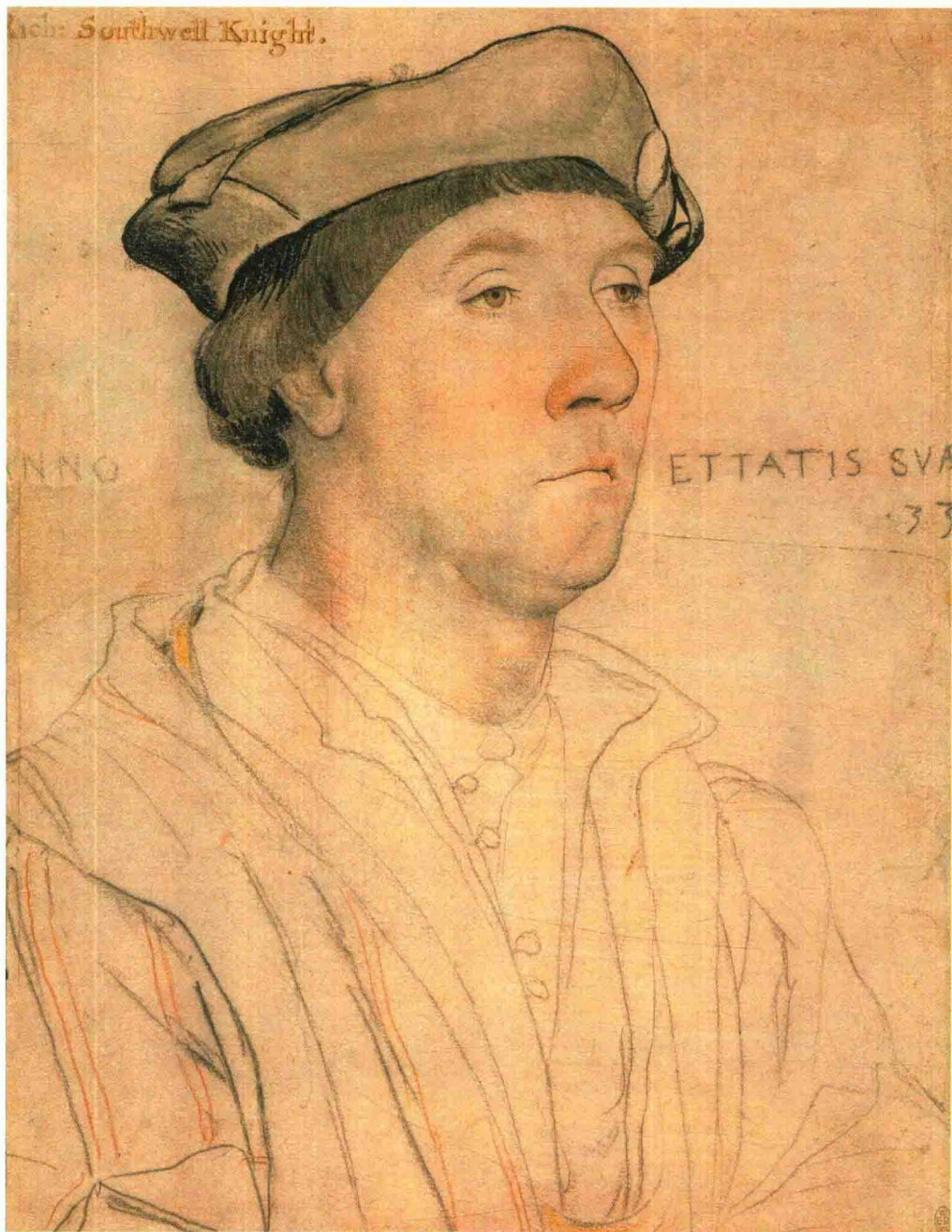
理查德·绍斯韦尔 1536年 石墨、色粉笔 366mmx277mm