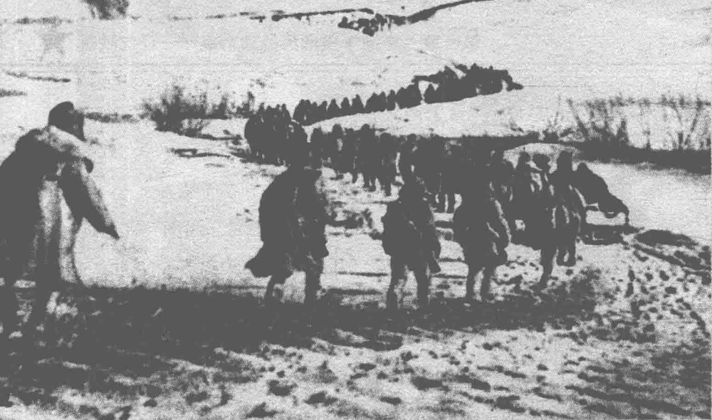
◎从1946年12月15日到1947年3月15日,东北民主联军举行了三下江南、四保临江的战役。图为部队冒严寒向松花江南岸挺进

“香饽饽”了。这里已经变成了巨大无比的沼泽，任何人都会被陷到这里，无力逃脱。杜聿明刚刚离开东北，国民党东北行辕主任熊式辉生怕自己成为“替罪羊”，竟然一连向蒋介石提交了7封辞职信。