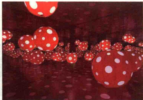
▲ 图1-5 草间弥生装置作品

但要注意的是，艺术是对美进行反映的一种文化样式，美只是艺术反映的对象，并不等于或者全部适用于艺术。艺术来源于生活，但又高于生活，只有将自然美和生活美进行再创造才能构成艺术，没有经过加工和再创造的自然美和生活美都不能称为艺术。