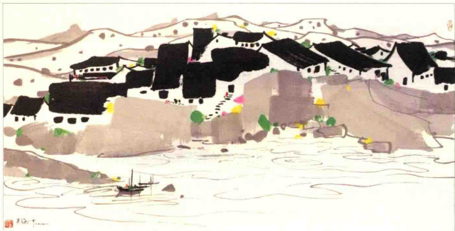
图1-3 吴冠中国画作品