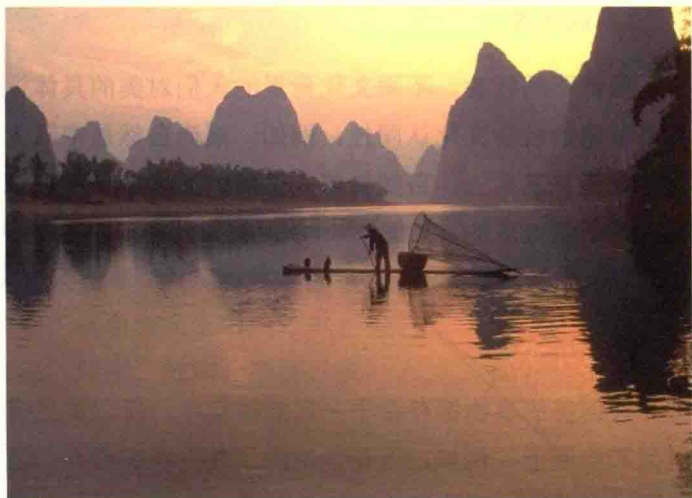
▶ 图1-6 桂林山水