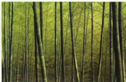
▲ 图1-2 苍翠挺拔的竹子

为什么说不自觉呢？因为人们的审美意识并不是消极的，而是积极的、主动的，人们总是积极主动地去改造自然，使之适应生活的需要。当人们在现实中获得了积极的肯定，感受到各种积极的、美的事物，人们就会获得喜悦和满足。美是人们在生活实践中积极创造的结果，也是人类在精神生活中获得的最高享受。