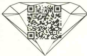
《第九交响曲》第四乐章欢乐颂欣赏