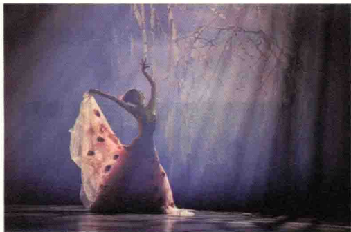
▲ 图1-4 舞蹈《雀之灵》