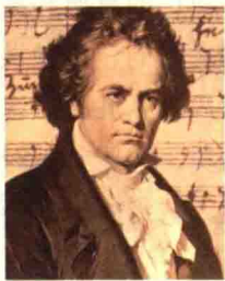
▲ 图1-7 贝多芬

贝多芬（见图1-7）的《第九交响曲》倾尽了他数十年的心血，是其音乐生涯的登峰造极之作。作品于1824年5月7日在维也纳首演，即获得巨大的成功。贝多芬通过该作品表达了人类寻求自由的斗争意志，并坚信这个斗争最后一定以人类的胜利而告终，人类必将获得欢乐和团结友爱。作品中的合唱部分堪称整部作品的精髓，以德国著名诗人席勒的《欢乐颂》为歌词谱曲而成，伴随着激情澎湃的唱词和急速雄壮的旋律，《欢乐颂》唱出了人们对自由、平等、博爱精神的热切盼望。