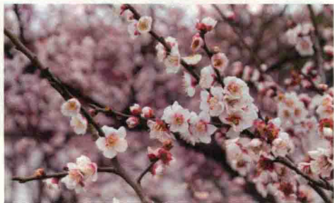
▲ 图1-1 傲立寒冬的梅花

客观事物是人们产生美感的基础。人们不自觉地被客观事物唤起了美感，获得了美的享受和精神感染。例如，当人们看到傲立于寒冬枝头的梅花时，便会想到坚韧不屈、铁骨冰心的高尚品格，如图1-1所示；看到苍翠挺拔的竹子时，便会产生奋发向上的气节之心，如图1-2所示。