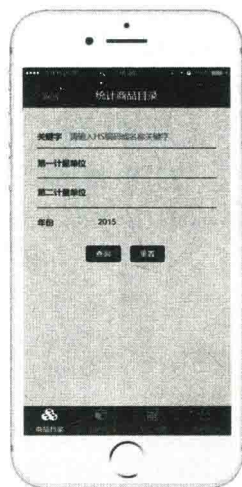
图3 “商品目录”版块界面