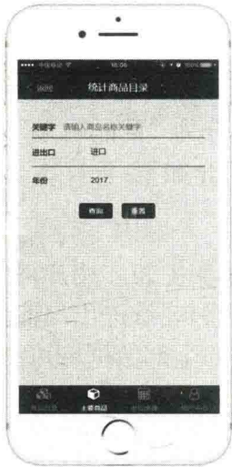
图4 “主要商品” 版块界面

“用户中心”版块（见图6）包括两个子项：一是“更新日志”，用于实时发布《统计商品目录》的更新内容；二是“使用说明”，用于介绍系统使用方法，以帮助用户更好地查询使用。