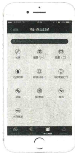
图5 “单位换算” 版块界面