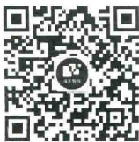
图1 “海关数库”微信公众号二维码

为更好地体现海关统计服务社会的职能，海关总署统计分析司委托中国海关出版社提供《中华人民共和国海关统计商品目录》（以下简称《统计商品目录》）移动版查询系统免费查询服务。上述查询系统嵌入中国海关出版社“海关数库”微信公众号中，读者通过微信扫描“海关数库”二维码（见图1），关注“海关数库”微信公众号，即可获得免费查询服务。