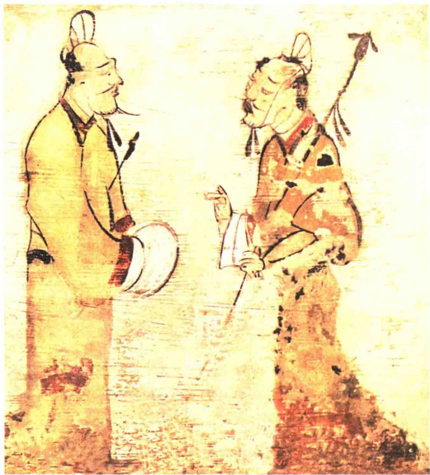
西汉 砖画 《迎宾拜谒图》

图》《人物御龙图》，战国时期的漆画《人物车马出行图》，西汉晚期的砖画《迎宾拜谒图》，东汉前期的壁画《门吏》，东汉后期的壁画《宁城幕府》等等。这一时期，中国绘画的主要形式有壁画、帛画、漆画等几种，它们主要出现在宫殿、寺庙、墓室等场所及一些器物上。它们的存在均是出于实用的需求，为了传经载道，如祭祀、纪念、教化等。