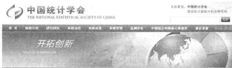
图 1-3 中国统计学会创始人李成瑞和学会的网站