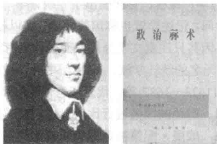
图 1-2 统计学的创始人威廉·配第和他的著作

图1-2所示为统计学的创始人威廉·配第和他的著作，图1-3所示为中国统计学会创始人李成瑞和学会的网站。