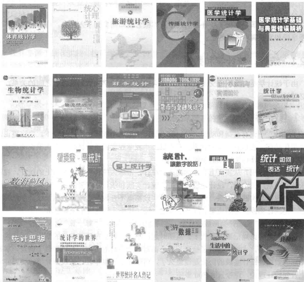
图 1-1 统计读物的封面

每年，还有大量的统计读物可供漫游，如《数海临风》、《看漫画，学统计》、《爱上统计学》、《统计，让数字说话》、《统计使人更聪明》、《统计如何“表达”统计》、《统计思想》、《统计学的世界》、《世界统计名人传记》、《漫游数据王国》、《生活中的统计学》、《统计连着我和你》等。下面，展示几本统计读物的封面(见图 1-1)，以增加一点观感。