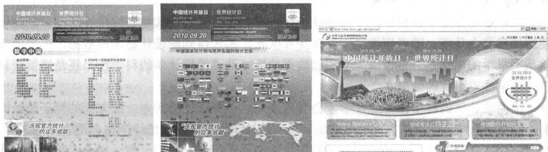
图 1-4 首届“世界统计日”和“中国统计开放日”宣传展板(制作：中国国家统计局)

未来统计学将是怎样的走势，笔者预计，统计学将更具全球化、人性化和生活化(参见图1-4)。随着电子网络的存在与发展，全球统计学将应运而生，以地球为村落进行统计，各国统计界的交往和合作将更为频繁。同时，个体统计学也将会走俏。统计学将青睐个人领域，如《幸福统计学》、《爱情统计学》、《网络统计学》、《个人理财统计学》等，个人将因此而受惠更多。可以满怀自信地憧憬，随着新生活的丰富多彩，随着时日的不断推移，新的统计方法也将不断被发现，这些新发现将为人们带来新惊喜，并将为新生活带来更多的充实和愉悦。