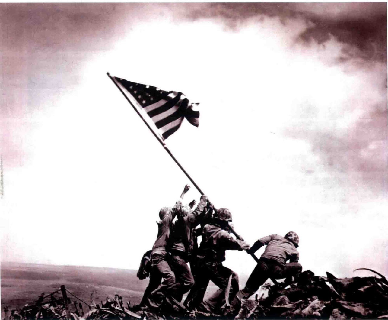
美国国旗升起在硫磺岛上

硫磺岛战役是第二次世界大战后期美军发动的最后一个岛屿攻坚战。由于日军守岛部队的困兽犹斗，2万余名美军血洒疆场。