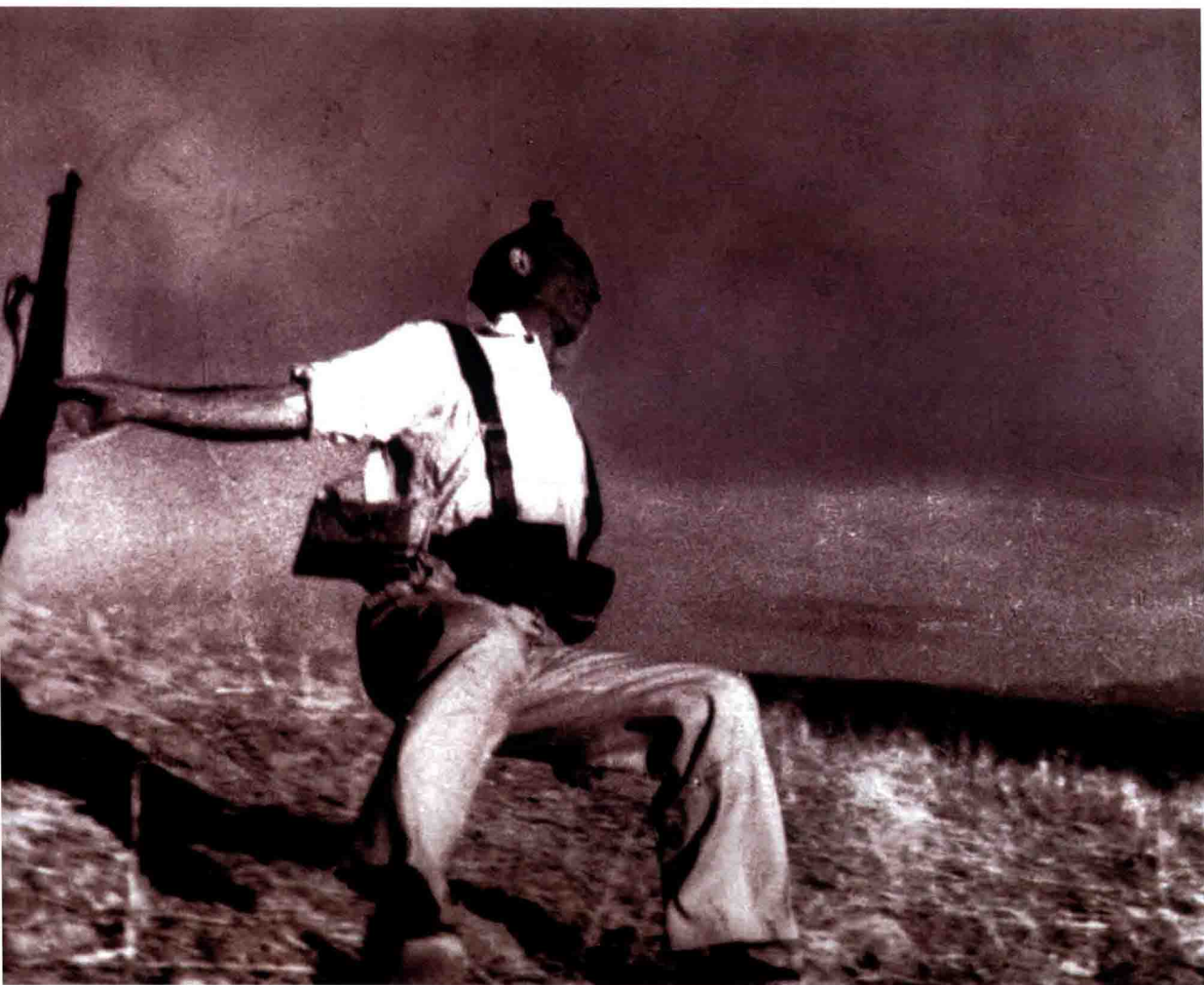
共和战士之死 摄影：【匈】罗伯特·卡帕