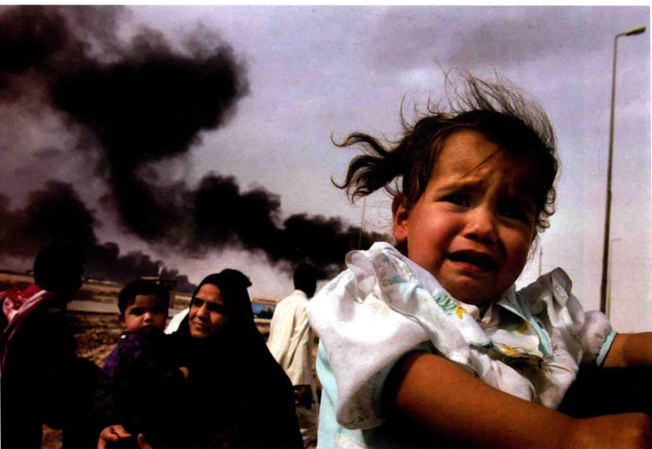
哭泣的巴士拉女孩

在军事题材的摄影中，不仅要关注军队，也要关注与军队和战争密切相关的平民。他们也是战争的参与者，更是受害者。平民的照片更能激发人类对于战争灾难的思考，也容易创造更多的国际舆论压力，推动战争尽快结束。