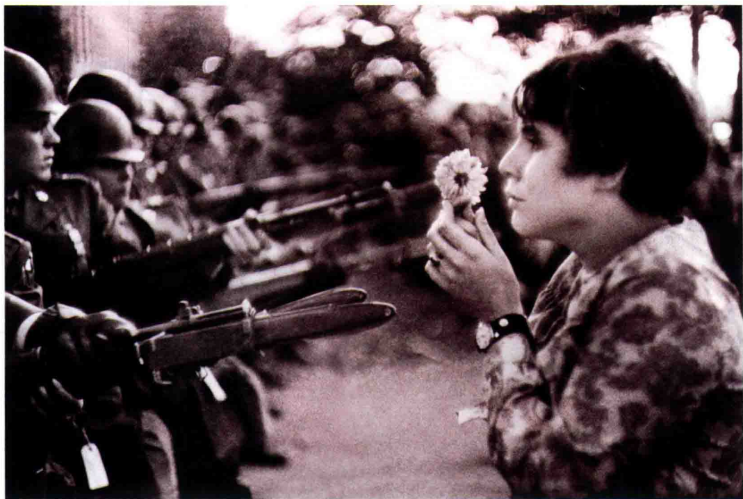
刺刀与少女 摄影：【法】马克·吕布

这幅照片是马克·吕布最著名的作品之一，记录了1967年美国华盛顿五角大楼前反越战游行的经典场景——手捧鲜花的女孩和士兵的刺刀形成了鲜明的对比。当时，气氛十分紧张，只有马克·吕布仍然坚守在那里，而他也几乎拍光了所有的胶卷。就在他的相机里只剩下最后一张胶卷时，手捧鲜花的女孩出现了，马克·吕布按下快门，拍下了这个极富象征意义的经典瞬间。