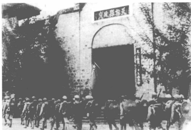
解放贵州第一 座县城——天柱