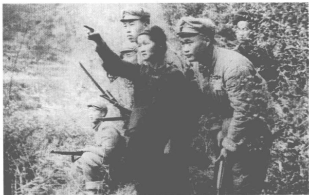
雷公山合围中 苗族老人带路追剿