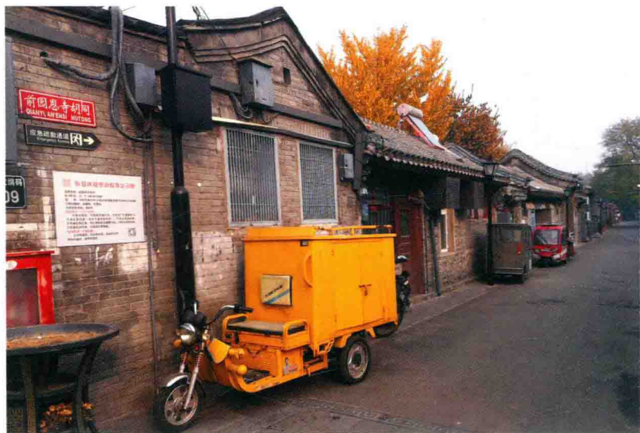
一 北京南锣鼓巷前圆恩寺胡同

谢辰生，公元1922年9月17日（农历七月二十六日）出生在北京南锣鼓巷一条叫前圆恩寺的胡同里（图一），名国愈，字辰生，号思庵。其祖籍为江苏省武进（今常州）罗墅湾南村，寄籍河南安阳。父亲谢宗陶（公元1887—1976年），字菊农，毕业于京师大学堂，曾先后任徐世昌、吴佩孚、商震、于学忠、熊斌等人秘书，财政组主任参议，河北省银行行长等职。中华人民共和国成立后，其父先后在天津圣功女子中学任国文教师，在河北