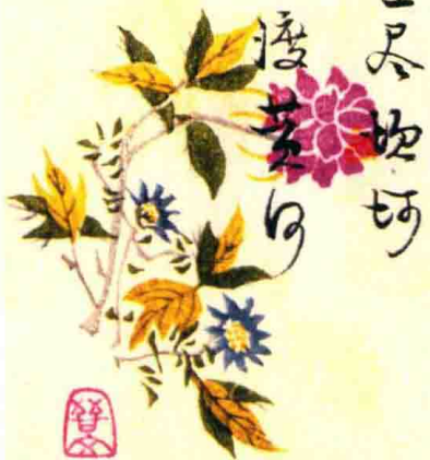
六 公元1944年秋，谢辰生于亳州作七律一首。