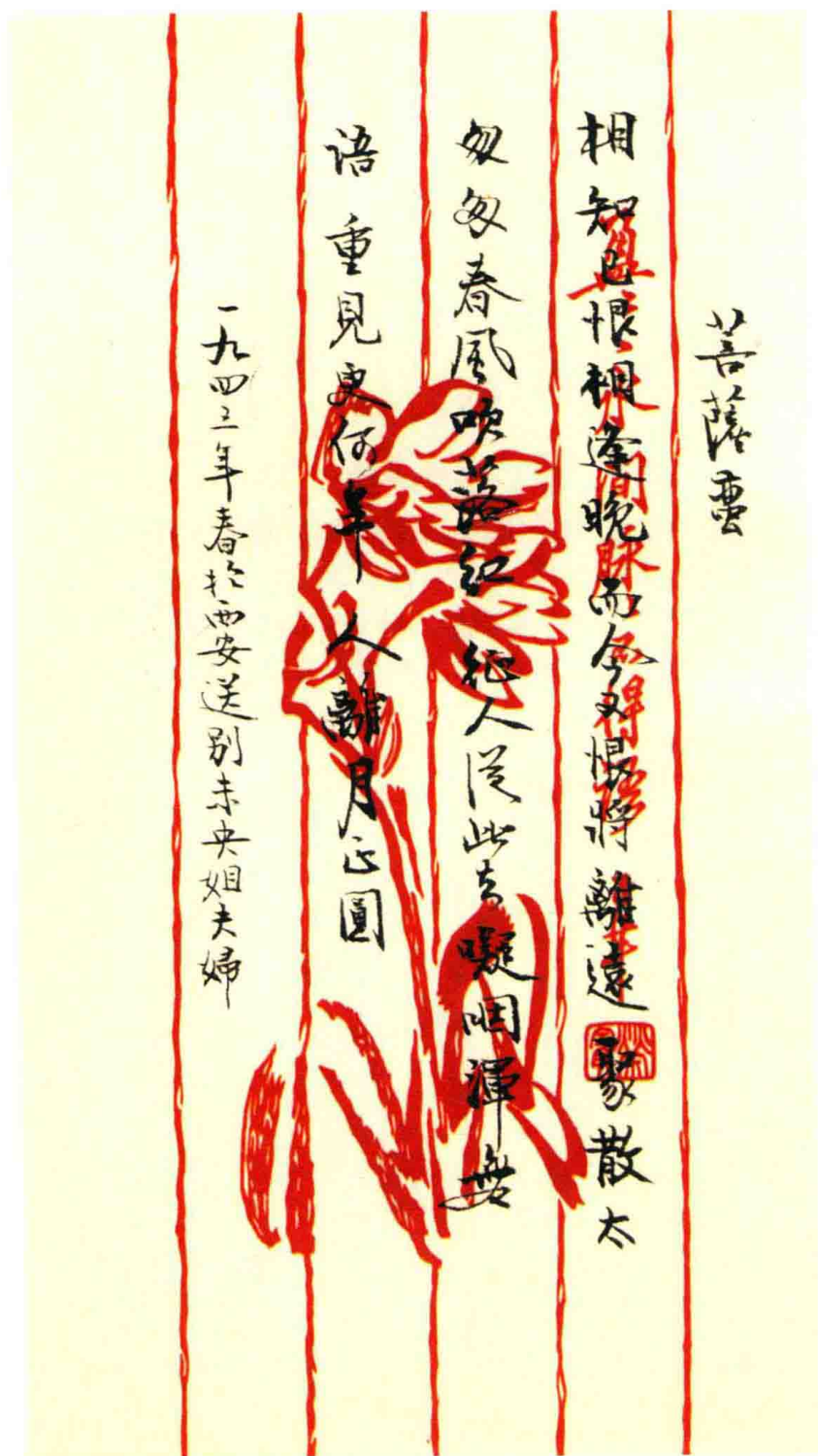
五 公元1943年春，谢辰生于西安作菩萨蛮一首。