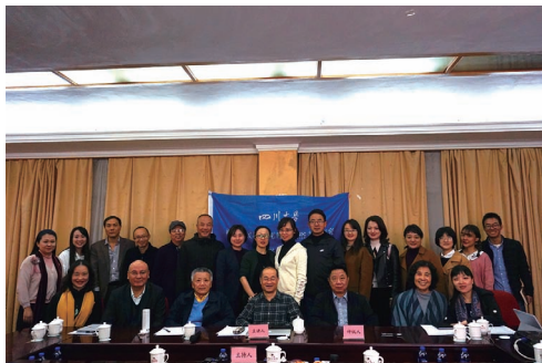
“西南多民族生死观与民俗考察研究” 田野工作坊参与人员合影

2018年12月7日至12日，四川大学中国多民族文化凝聚与国家认同协同创新中心主办的“西南多民族生死观与民俗考察研究”田野工作坊在云南举行。本次工作坊围绕教育部人文社科基地十三五规划的重大项目“西南多民族生死观与民俗考察研究”展开，赴云南蒙自、建水、玉溪等地实地调研，并以田野考察为基础进行近十场讨论。