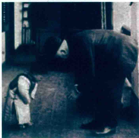
梅藤更与小患者相互鞠躬行礼

相互鞠躬行礼。小孩儿四五岁的样子，穿着长衫；大老外年过半百，戴着礼帽。那名小患者自是可爱，而梅医生不是更可爱吗？这是一百年前医患关系的真实写照，体现了医患之间不分长幼、无论贫富、相互尊重、平等相待的感人情景，同时也表达了患者对救死扶伤的医生的感激，体现出医生对患者的无私大爱与甘愿奉献精神。这种相互间的“敬”——敬重、敬爱、敬畏，就是礼仪的实质，也是医护人员工作的核心价值所在。