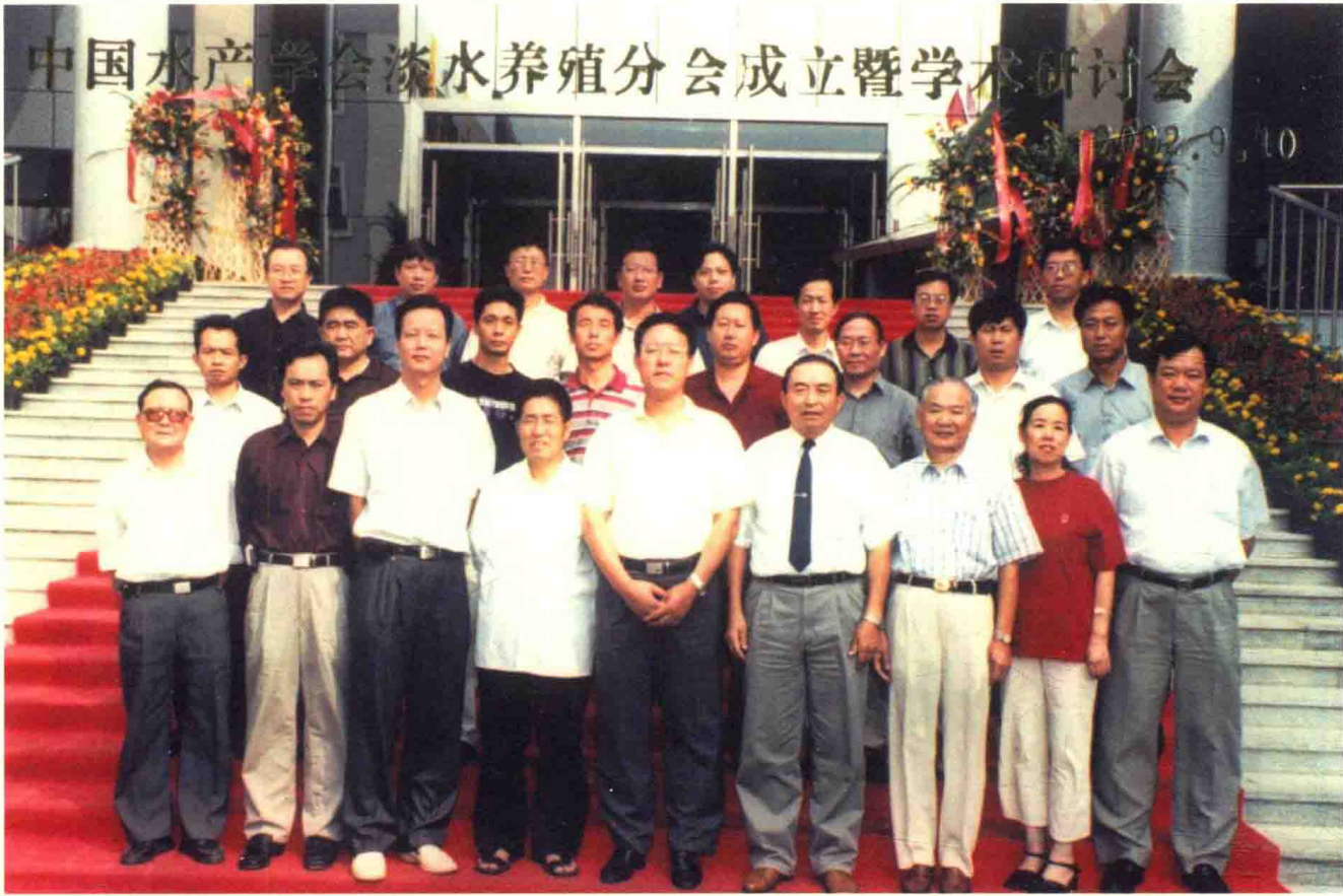
中国水产学会淡水养殖分会成立大会暨学术讨论会留影（2002年9月10日）