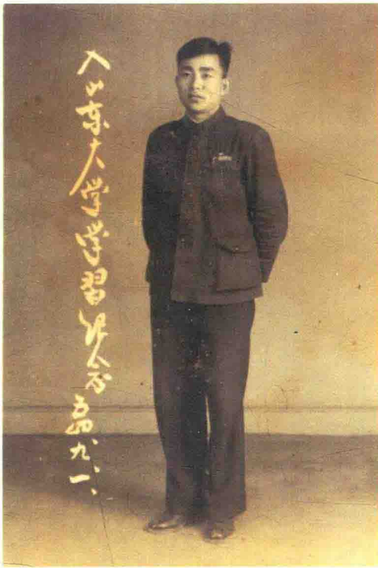
山东大学入学留影纪念（1954年9月）