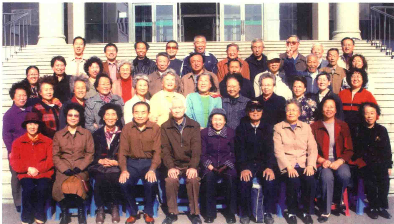
与20世纪70年代养殖系教职工合影留念（2006年11月1日）