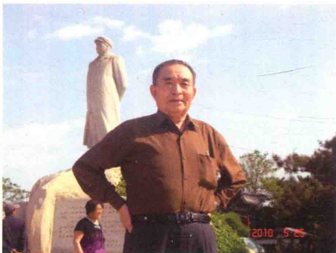
华南农业大学校园留影