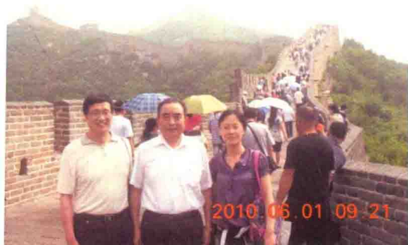
与研究生留影纪念