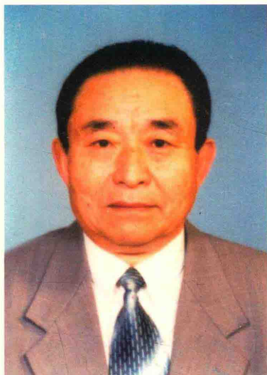
退休留影纪念（2005年10月）