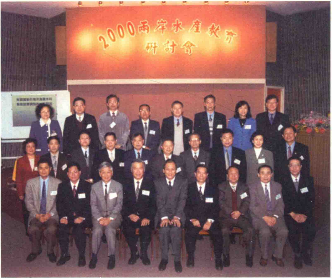
2000年两岸水产教育研讨会留影（2000年1月26日于我国台湾基隆）