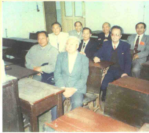
山东大学1954级同学在原教室留影纪念 （1996年10月）