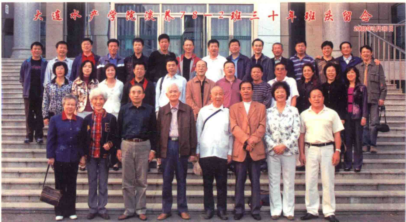
淡水渔业专业1978级2班30年班庆留影纪念（2008年9月30日）