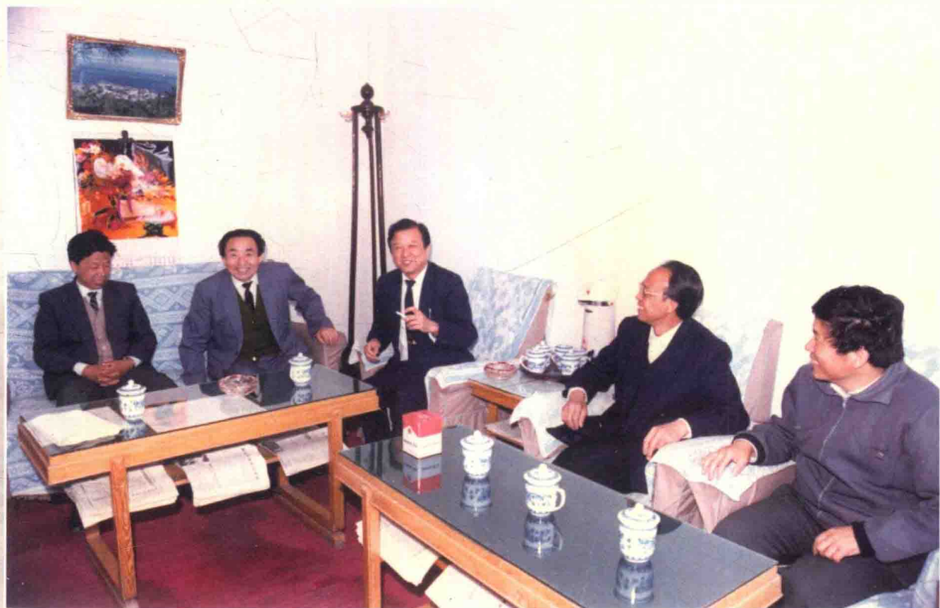
大连水产学院领导班子成员合影（1992年11月）