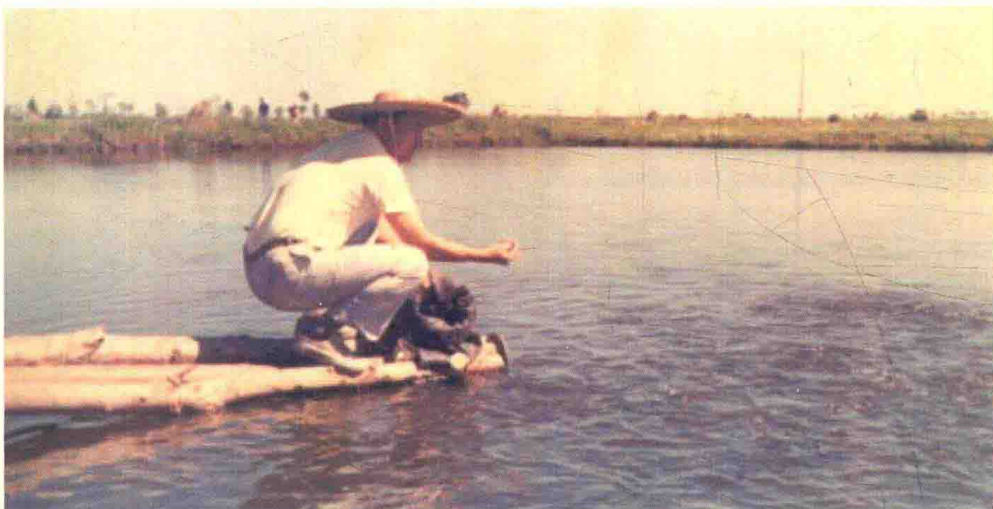
在镇赉养鱼池给鲤投喂人工饵料（1989年9月）